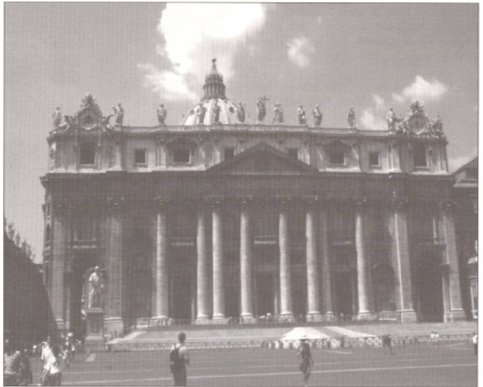
Basilique Saint-Pierre, Rome.

La relation entre l'orientation muséale et l'ouverture au tourisme n'a pas toujours été évidente et ne l'est pas nécessairement aujourd'hui dans tous les cas 2 . Le rapport entre l'organisation et le visiteur a évolué, de sorte que la satisfaction du visiteur est maintenant intégrée à la mission culturelle des musées. Si l'on insère la religion dans la relation, la complexité des arbitrages à accomplir monte d'un cran. La définition de la mission et des objectifs dans ce contexte pastoral-touristique-culturel et l'équilibre que cela suppose sont illustrées à la figure 1. L'équilibre à atteindre y est illustré par