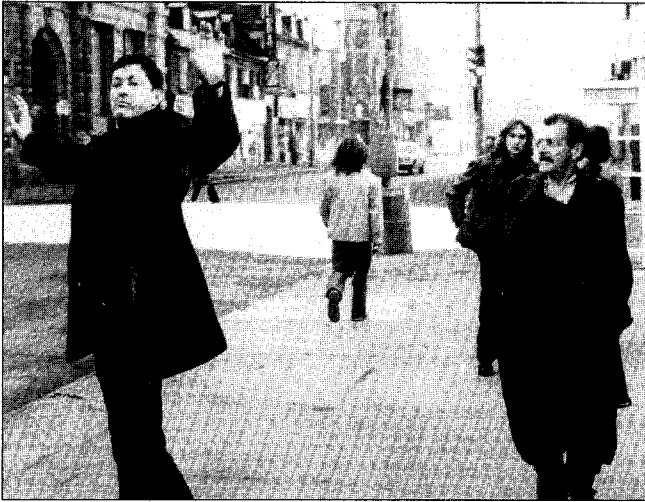
Les grands enfants (Paul Tana, 1980)