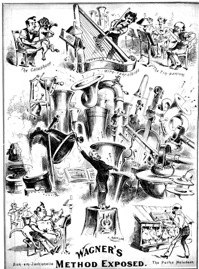
Illustration 1. Wagner: les rythmes de la nature et de la vie (Keppler 1877, 16). Aucune restriction connue liée au droit d'auteur.

Car l'égalité esthétique, nous dit Rancière, c'est aussi le langage qui se vide de son sens, qui s'abaisse à l'irrationalité des choses quelconques. L'écriture muette, ici, n'est plus la beauté secrète ou le message encodé dans le sensible, mais « la parole sourde d'une puissance sans nom qui se tient