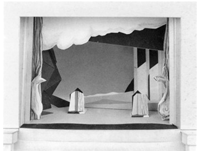
Illustration 1 Photo de la maquette du décor du Train bleu , reconstitué par Selim Saïah pour l'Opéra de Paris, 1992.

L'arrangement des différents éléments de ce décor permet de situer l'action, qui se déroule sur une de ces plages courues par la mondanité française. À droite, juste devant la mer qui se trouve complètement à l'arrière-scène, s'élèvent de grands panneaux rectangulaires tenant lieu de murs du casino anonyme. Ces panneaux sont déposés sur une plate-