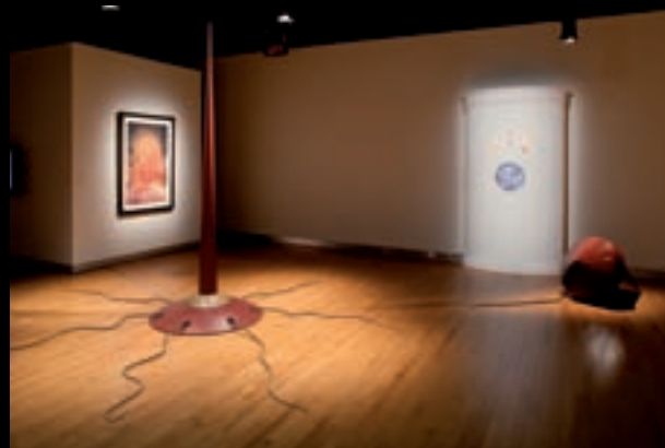
Rouges, 2000-2002 275 cm x 750 cm x 750 cm ; bois, contreplaqué, résine de fibre de verre, résine de coulée, polyuréthane flexible, moteurs, système d'engrenages, composants électriques et électroniques, vidéo, photographie : tirages à jet d'encre.