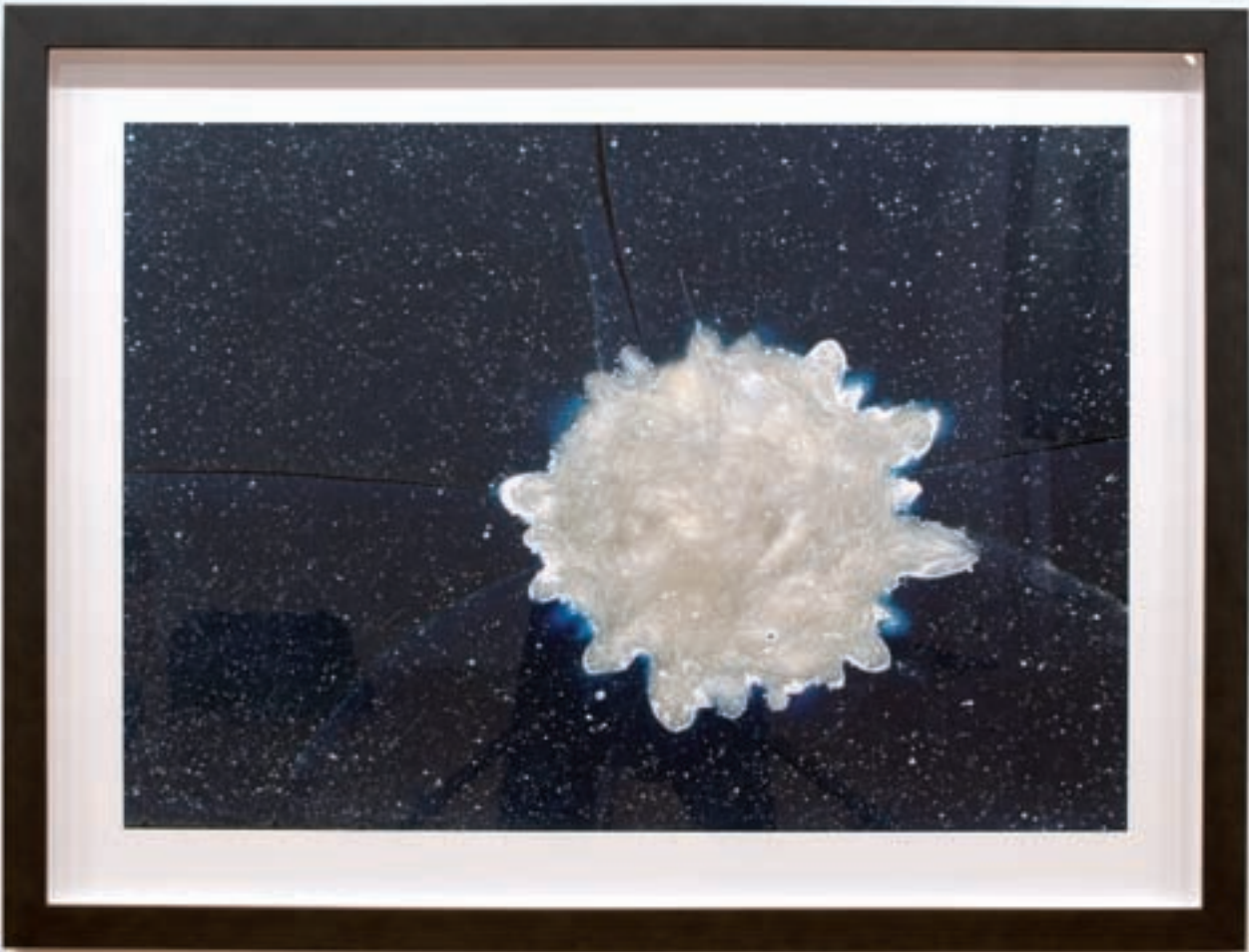
Être \ Ne pas être, 2007 à 2009 Photographie : 95 x 120 cm (chacun); tirages à jet d'encre

Rousseau explique que le fort ascendant du Pop Art sur son travail provient, en partie, de ses origines franco-ontariennes qui lui ont fait côtoyer, dès sa plus tendre enfance, une culture majoritairement anglo-saxonne. Même si celle-ci le rapprochait plus de nos voisins du sud et du ROC, il n'en demeure pas moins que la crainte de l'assimilation au rouleau-compresseur étatsunien était très prégnante au sein de sa famille.