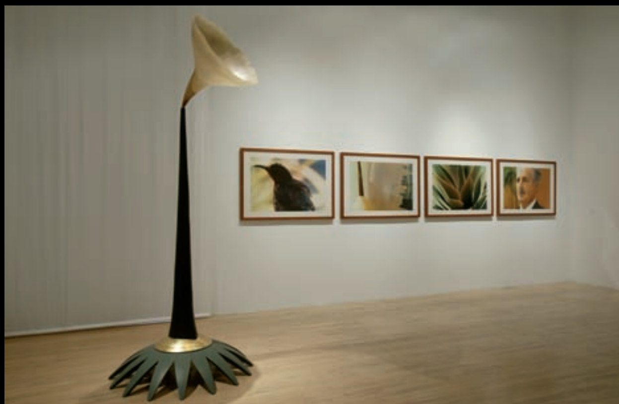
Inaudible, 1996 251 cm x 560 cm ; résine de fibre de verre, bois, métal, feuilles d'or, photographies (tirages chromogènes).