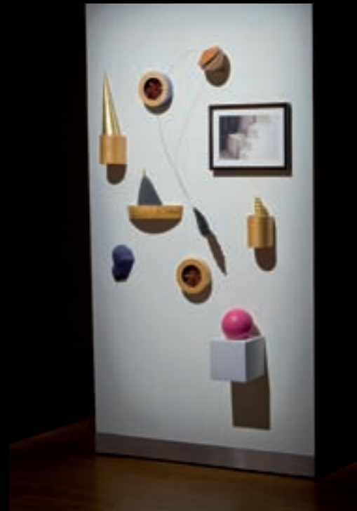
Démarche, 2003-2004 200 cm x 120 cm x 25 cm ; bois, fil de métal, polyuréthane, résine de coulage, résine de fibre de verre, poudre de carbure de silicium, silicone, feuilles d'or, peinture, sel, photographie (tirage à jet d'encre). Ne pas être, 2009 (droite de l'image - détail) Photographie: 70 cm x 50 cm; tirage à jet d'encre.