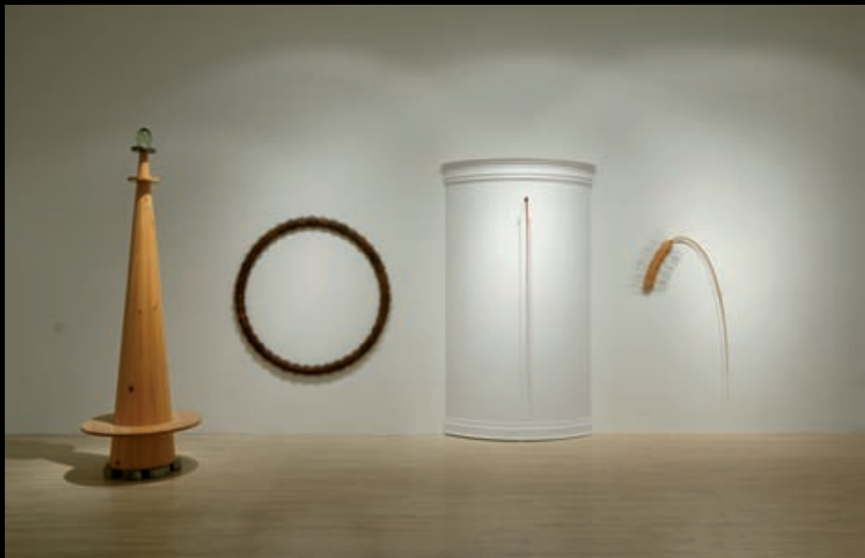
Trois contes et une gigue, 1997 260 cm x 750 cm x 260 cm ; bois, contreplaqué, verre, plomb, graphite, polyuréthane, métal, moteur, système mécanique, détecteur de mouvement et composants électroniques. Musée régional de Rimouski.