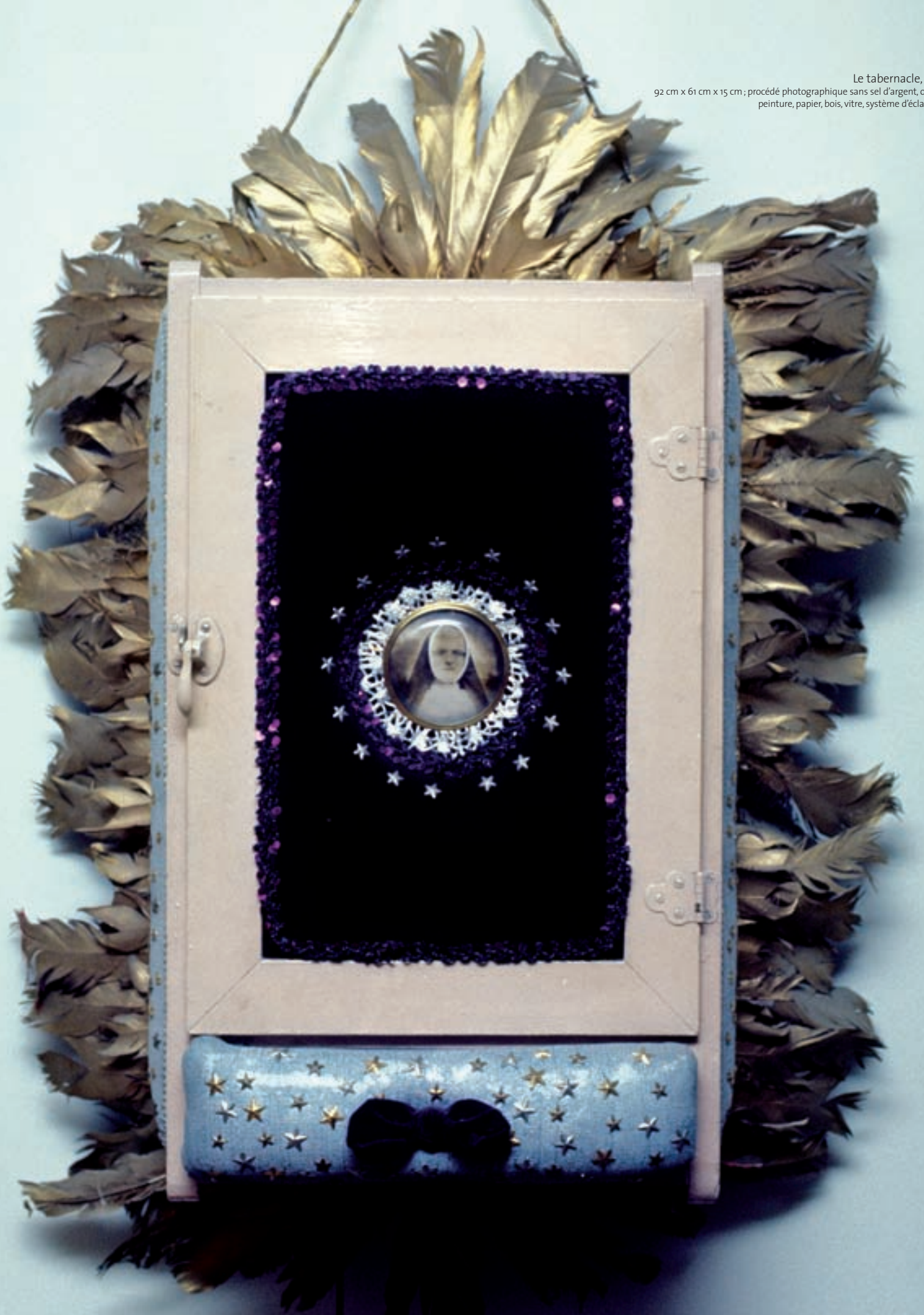
Le tabernacle, 1975 92 cm x 61 cm x 15 cm ; procédé photographique sans sel d'argent, objets, peinture, papier, bois, vitre, système d'éclairage.