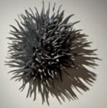
Cils #2 (détail)