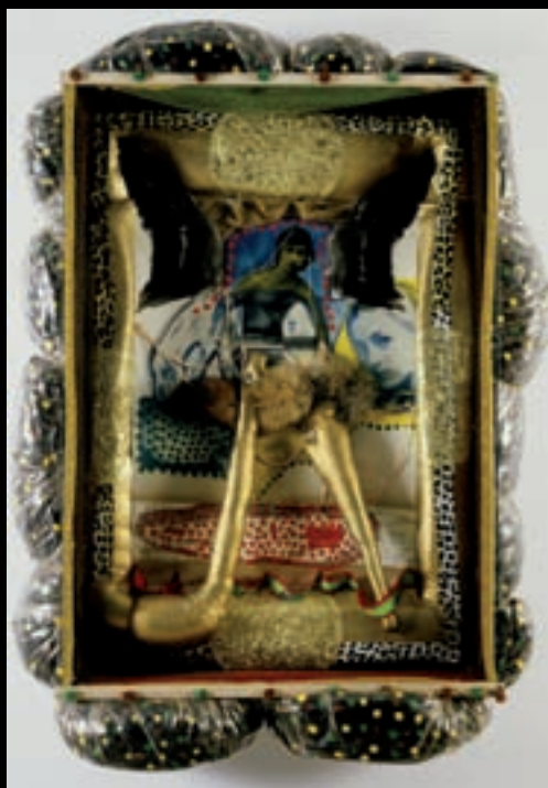
Membrane amoureuse, 1975 155 cm x 90 cm x 30 cm ; procédé photographique sans sel d'argent, film ortho, papier, acrylique, canevas, vinyle, objets.

Les cours de dessin et de peinture à l'huile — qu'il suivait avec les religieuses de son enfance — et ses observations sur les réparations que son père ingénieur s'est activé à exécuter sur des postes de télévision, allaient nourrir ses manières de faire et son imaginaire. Durant ses années de formation à l'Université d'Ottawa, Rousseau s'est inspiré, notamment, de la photographie documentaire, de l'art cinétique des débuts du vingtième siècle — par exemple avec le Modulateur Espace-lumière de Moholy-Nagy — et de l'art vidéo naissant. Mais c'est d'abord et avant tout le Pop Art des années soixante aux États-Unis qui a opéré un ascendant important sur sa démarche de création. Le travail de l'artiste américain Robert Rauschenberg y a été pour beaucoup, plus particulièrement avec la série des Combine paintings qu'il a réalisée entre 1954 et 1961.