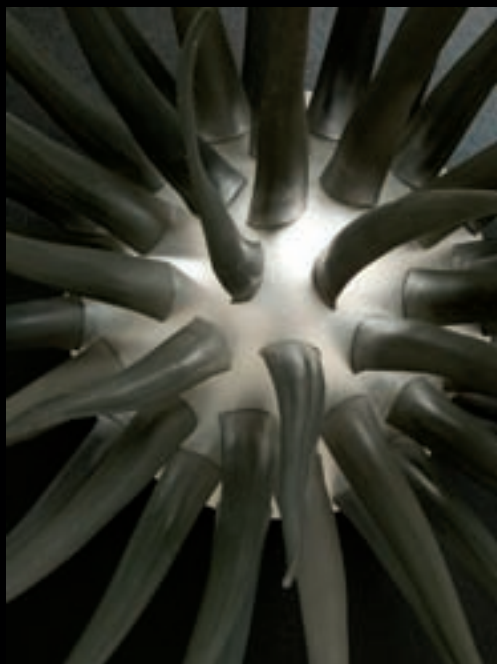
Sondes, 1994 (détail) 295 cm x 450 cm x 250 cm ; bois, contreplaqué, résine de coulage, résine de fibre de verre, moteurs avec systèmes d'engrenages, composants électroniques.