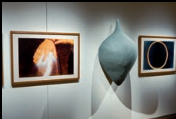
Tactile, 1995 (détail) 240 cm x 600 cm x 60 cm ; résine de fibre de verre, poudre de carbure de silicium, photographie : tirages chromogènes.