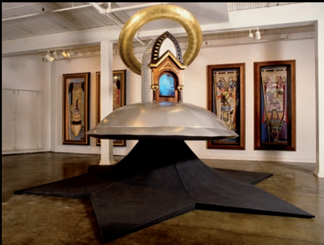
L'installation de l'indifférence, 1987-1988 270 cm x 750 cm x 750 cm ; bois, contreplaqué, bois aggloméré, objet trouvé (tabernacle), feuilles d'or, poudre de carbure de silicium, moteurs, systèmes d'engrenages, détecteur de mouvement, composants électroniques, vidéo, bande sonore. Musée national des beaux-arts du Québec.