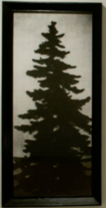
Le discours, 1989 Sculpture : 330 cm x 240 cm x 240 cm. Photographie : 236 cm x 115 cm x 9 cm. Matériaux : bois, contreplaqué, résine de fibre de verre, feuilles d'argent, peinture, moteurs, systèmes mécaniques, système d'éclairage, composantes électroniques, bande sonore, photographie : tirage chromogène.