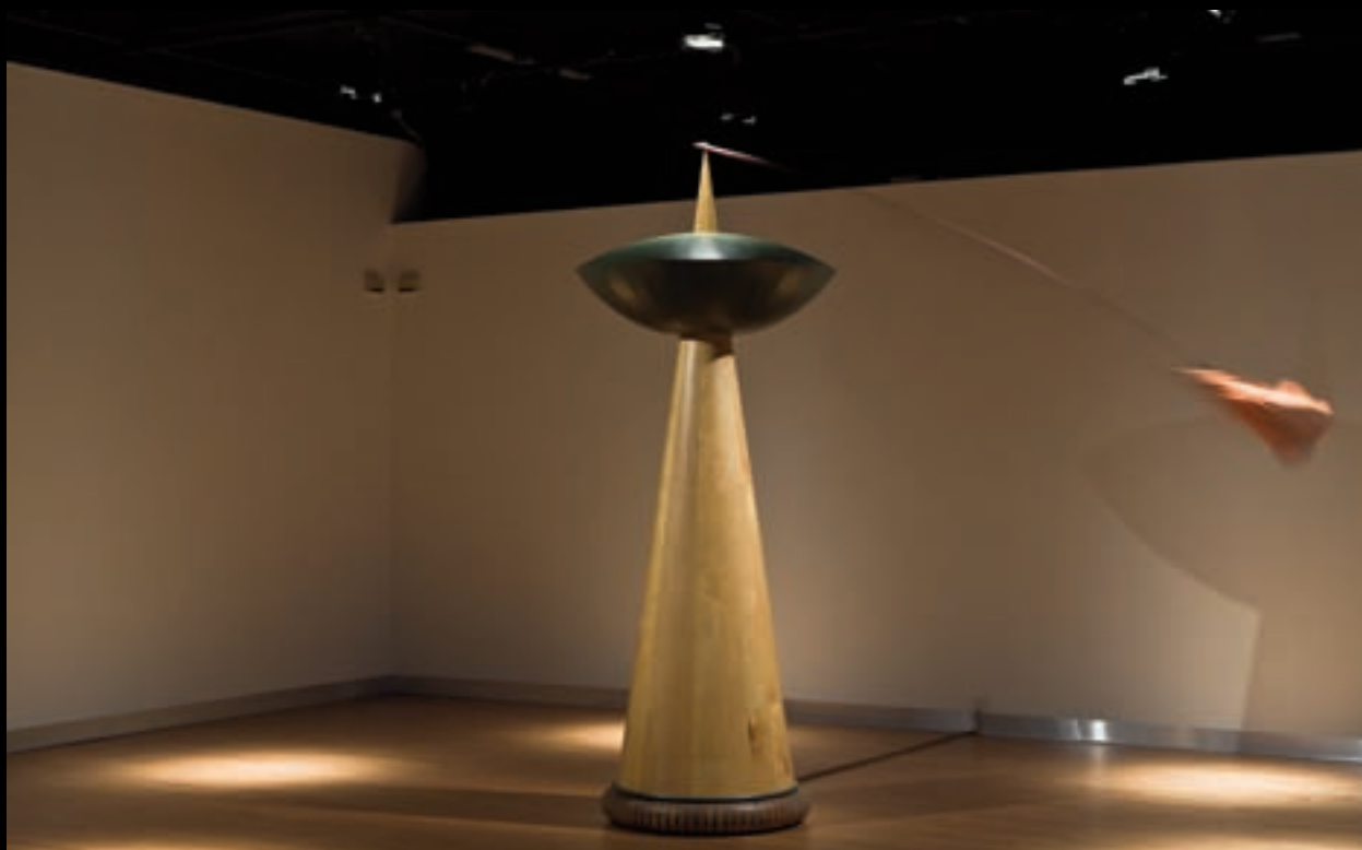
Soufflet, 1997 300 cm x 300 cm x 300 cm ; bois, résine de coulage, tige en fibre, tissu, moteur, système mécanique.