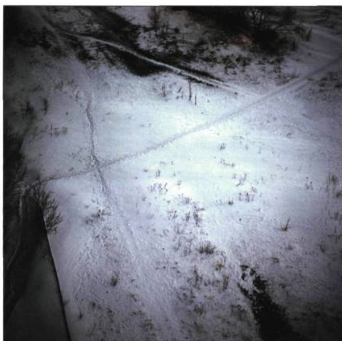
N° 205 Emmanuelle Léonard

Rencontre , 2003, acrylique sur toile, 145 cm x 217,5 cm.