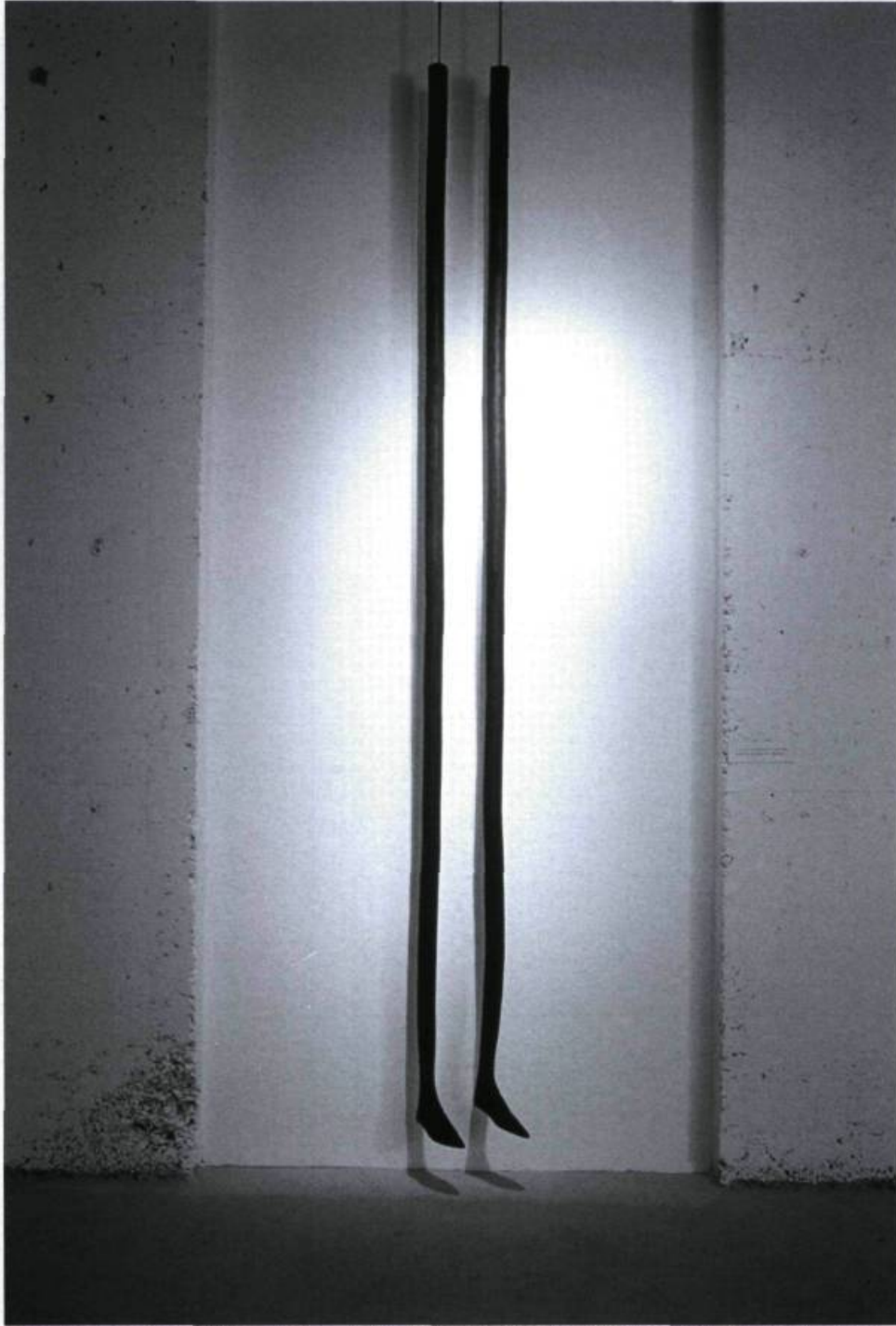
Louise Bourgeois, Legs , 1986, caoutchouc, 1 : 309 × 2 cm, 2 : 313 × 2 cm.

« À partir d'une connaissance exceptionnelle de l'art contemporain, nourrie de poésie, avec un doigté subtil, il [le commissaire Roger Bellemare] a composé une section tout à fait impressionnante. Abordant le thème en se référant déclarativement au chemin de la Croix, il a sélectionné quatorze œuvres qui s'échelonnent de 1958 [...] jusqu'à aujourd'hui. Mais les œuvres ne sont pas des illustrations des étapes du chemin de la Croix. Chaque station a d'abord été interprétée comme un thème plus abstrait (ceux qui touchent toute l'humanité : angoisse, douleur, etc.) et les œuvres ont été choisies pour évoquer, par toutes sortes d'associations, le thème de chaque station. Le parcours de cette section est ponctué de surprises : la date du Rainer, les personnages de Lemire, entre autres. Souvent les artistes ne sont pas d'emblée identifiables; par exemple, le Nauman, le Bourgeois dont l'accrochage est d'une ingéniosité à souligner » (René Payant, « Une rhétorique du ralentissement », critique de Stations , Centre d'art contemporain de Montréal, Place du Parc, du 1 er août au 1 er septembre 1987).