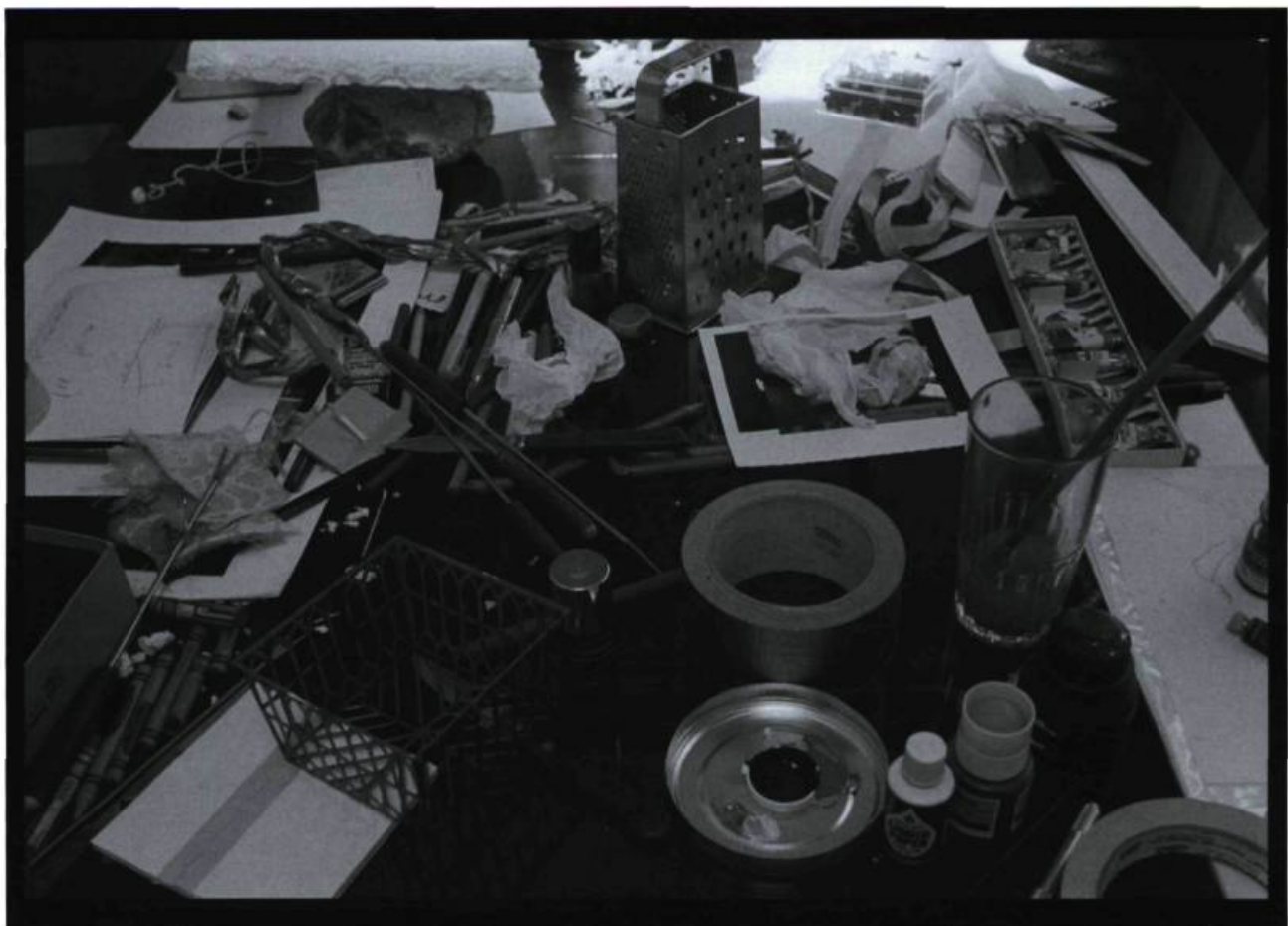
Raymonde April, Tableaux sans fond, Ma table , 1985, 84 × 116,5 cm, épreuve argentique

Avec inquiétude, Victor songea que ce qui était vrai du mot « vache » l'était tout autant des mots basse-cour, œuf à repriser, collier en sautoir, monocle, porte-bouteilles, filature de coton, Gary Cooper, Ravensbruck. De larges pans de la réalité disparaissaient, tandis que les mots la désignant continuaient de scintiller un moment, avant de perdre leur éclat et de disparaître à leur tour des mémoires, ou alors de connaître un sort plus funeste en sombrant dans la préciosité, supplantés par d'autres mots désignant d'autres réalités et que l'usage décréterait plus commodes. En somme, l'esprit humain se purgeait régulièrement, et cette amnésie volontaire ne facilitait pas la tâche à ceux qui, comme Victor, évoluait sur l'horizon de la mémoire. Ce n'était pas être nostalgique que de le regretter. Et puis, l'inquiétude de