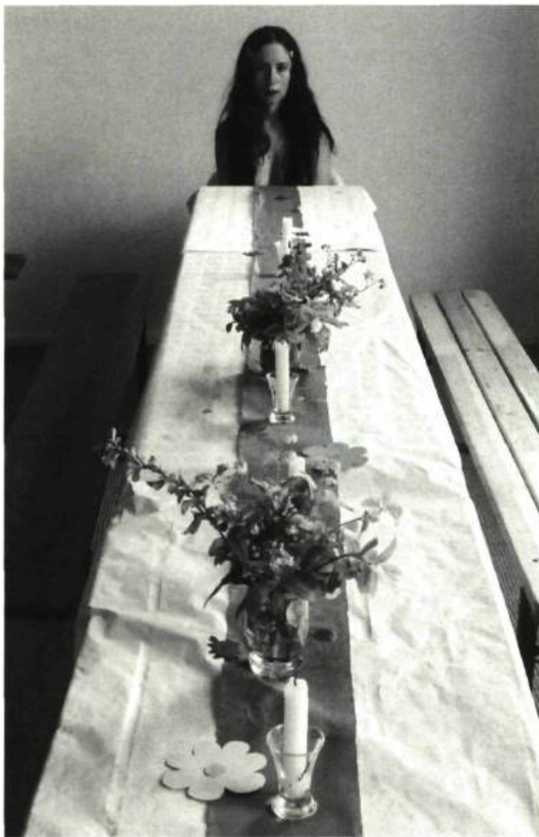
Gullivers in Love de F. et B. Haxhillari, 1999