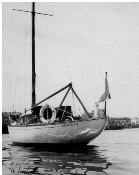
FIGURE 13 – Au mouillage à la Trinité-sur-Mer en 1952.

La seconde partie s'attache dans un premier temps à revenir sur les architectes, constructeurs des bateaux ayant bercé mon apprentissage. Ces derniers ont un point commun : ils sont tous des acteurs ou des héritiers directs de cette ère de conquêtes et ont largement contribué à l'émergence, dans les années 1970 à 1990, de l'excellence française désormais reconnue dans le domaine de la course au large. Cette seconde partie se veut être autant technique qu'illustrée sur les points d'orgue de la restauration de mon petit classique, opérée entre 2008 et 2017. Je relate les conseils prodigués par quelques grandes figures de la plaisance traditionnelle, l'expérience d'une démarche de classement d'un voilier aux monuments historiques par le Ministère de la Culture, sans oublier la collaboration avec les acteurs de la DRAC, du conseil régional de Bretagne, du conseil général du Finistère et de la commune de Crozon, qui est aussi consignée.