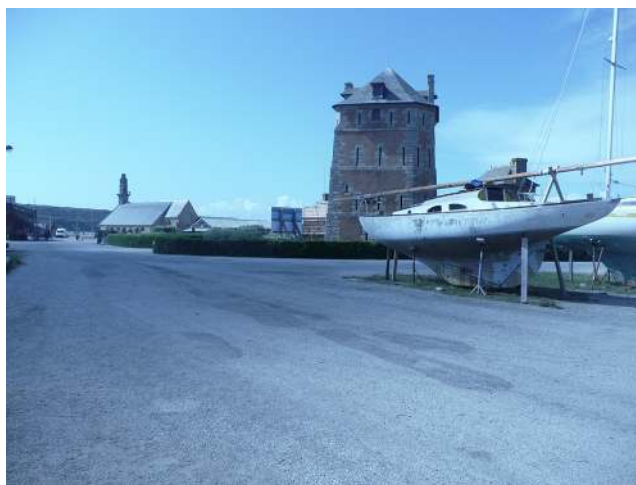
FIGURE 3 – Arrivée au chantier CMC – juin 2009.