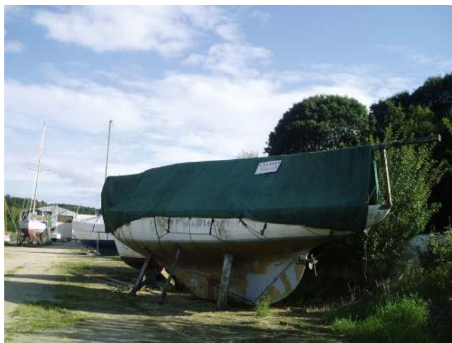
FIGURE 4 – Danycan, le jour de sa découverte en 2008 à Saint-Martin-des-Champs au chantier A. Jézéquel.