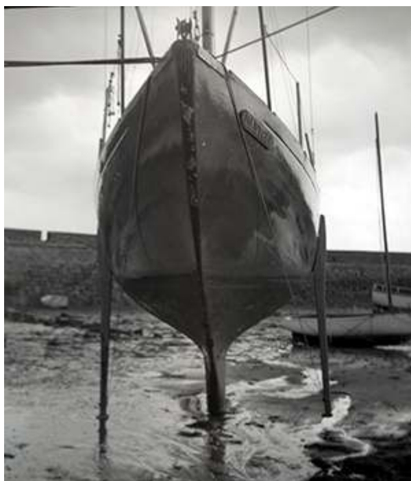
FIGURE 12 – Mouillage, dans le vieux port de Roscoff vers 1981.

Des déplacements dans de nombreuses librairies spécialisées ou des brocantes, et l'analyse d'articles, de livres, de répertoires du Lloyd ont complété ma quête d'informations. Je me suis rendu sur les lieux de l'établissement Pierre Delmez Constructions Nautiques et à Saint-Servan, cité où se situe la malouinière de la famille Danycan. Pour résumer, un travail d'investigation considérable m'a permis de reconstituer progressivement le contexte historique de ce voilier.