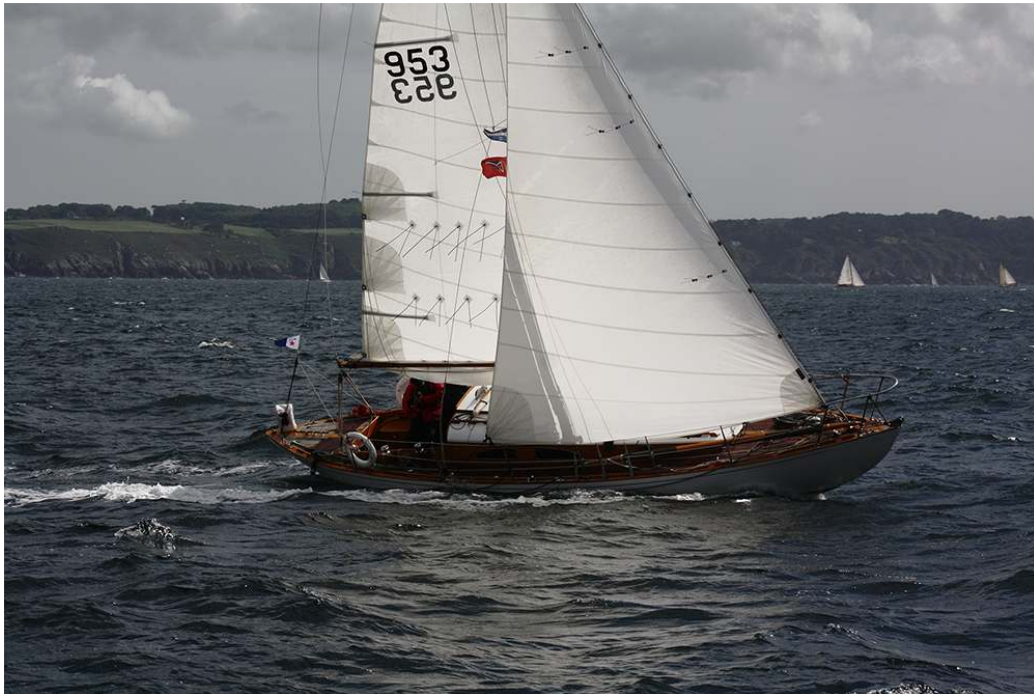
FIGURE 1 – Danycan – Coupe des deux phares 2017.