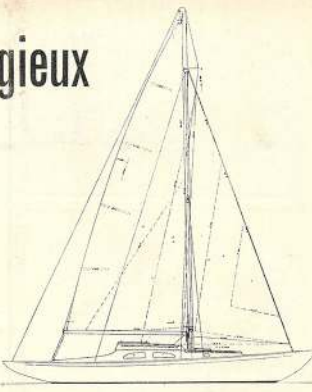
FIGURE 9 – Article paru dans la revue Le Yacht le 18 mars 1961