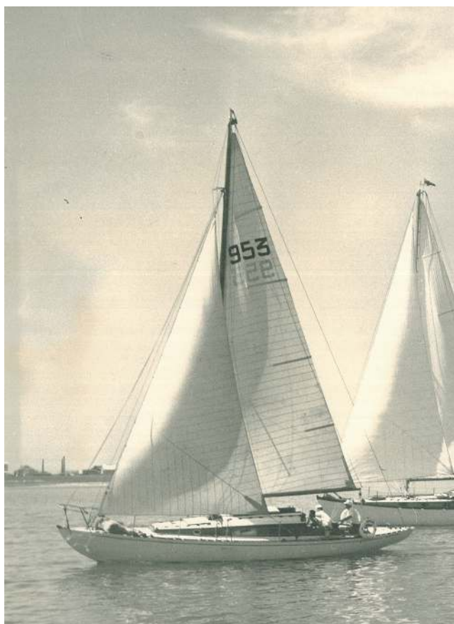
FIGURE 5 – Régates de La Rochelle en 1957.

Danycan a donc navigué et régaté bien souvent aux côtés de bateaux très connus qui, pour certains, naviguent voire régatent encore. Outre ses très belles lignes, ce vieux cruiser-racer s'avère avoir un passé prestigieux ayant largement contribué à l'offensive des yachtmen français face à l'hégémonie anglo-saxonne dans les courses du RORC durant les années 1950, qui sera couronnée par la victoire de 1964. De plus, Danycan peut être cité pour avoir accueilli à son bord, dans le cadre de courses-croisières et avant qu'il ne soit célèbre, un homme devenu aujourd'hui la légende de la voile française, ainsi que son père, Guy Tabarly, qui en fut un équipier fidèle de 1954 à 1961. Voici ce qu'écrit Eric Tabarly dans son livre Mes bateaux et moi (1974), paru en 1976 : « Les bateaux de course au large manquant souvent d'équipiers, mon père et moi nous engageâmes à bord de nos premiers coursiers locaux : Fa-