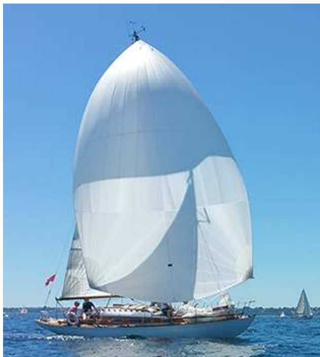
FIGURE 6 – Grand prix de Brest 2016.