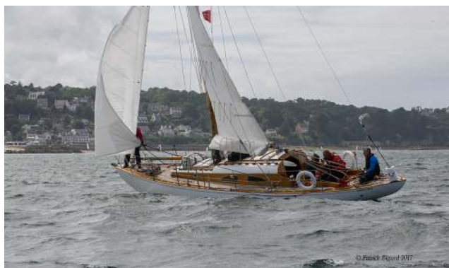
FIGURE 7 – Prologue de la Coupe des Deux Phares en baie de Douarnenez en 2017.