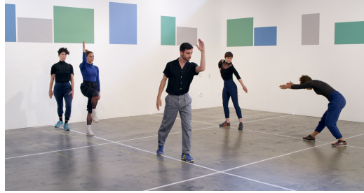
FIGURE 4 : Fig. 4 Julien Prévieux, What Shall We Do Next ? (Séquence # 2), 2014.

Les chorégraphies de danse contemporaine, qui trouvent notamment leurs fondements dans le mouvement de danse postmoderne 9 , permettent donc tout à la fois la reproduction, la répétition, la déformation et la fabrication de gestes et d'interactions. Comme l'affirme Louppe (1997), chorégraphe signifie avant tout composer, le chorégraphe et les interprètes étant en quelque sorte dans un laboratoire d'écriture où les mouvements s'inventent et s'organisent. Ici apparaît une distinction fondamentale entre deux principales acceptions du terme chorégraphie, soit l'« acte d'écrire la danse », lequel renvoie principalement à la notation, à l'action scripturale, et l'« acte de créer les gestes », qui renvoie à leur composition, à leur invention 10 . Cette distinction apparaît particulièrement intéressante pour penser l'œuvre de Prévieux. Parce que si sa chorégraphie vise à imaginer, inventer nos gestes à venir, renvoyant ainsi à la deuxième acception du mot, elle le fait en puisant dans un répertoire d'objets brevetés, présentant par des moyens scripturaux (mots, dessins, schémas) les gestes qu'ils engagent.