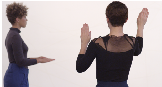
FIGURE 3 : Fig. 3 Julien Prévieux, What Shall We Do Next ? (Séquence # 2), 2014.

Si les brevets sont déposés par leurs inventeurs sans assurance d'avoir un jour une véritable fonction, ils contribuent néanmoins, archivés au milieu de leurs semblables, à écrire ce que pourrait être notre avenir corporel, si on les prolonge par les gestes qui implicitement les habitent.