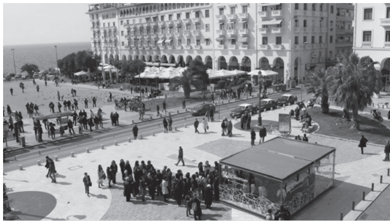
Un des sites du Festival de Thessalonique

J'ai vécu dans plusieurs pays, incluant le Canada, l'Angleterre, les États-Unis. J'ai facilement eu accès à l'information, la culture, à travers quantité de moyens. J'ai baigné dans des sociétés libres, c'est-à-dire dans lesquelles on ne dépend pas d'une seule source d'information, mais de plusieurs. Quand je suis finalement rentré en Grèce, après l'avoir quittée pour vingt-quatre ans, j'avais l'impression de suffoquer. C'était une société très fermée. Aujourd'hui, je rencontre des jeunes qui partagent ce sentiment: formés à l'étranger, ils reviennent et ont l'impression de ne plus comprendre leur pays. Or, les moyens d'information existent pleinement (Internet, presse); tout se joue désormais par leur remise en cause critique.