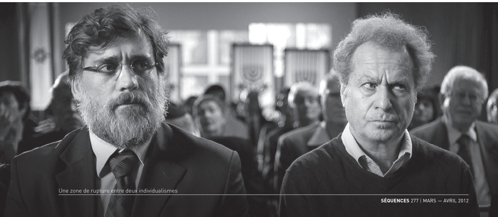
Une zone de rupture entre deux individualismes