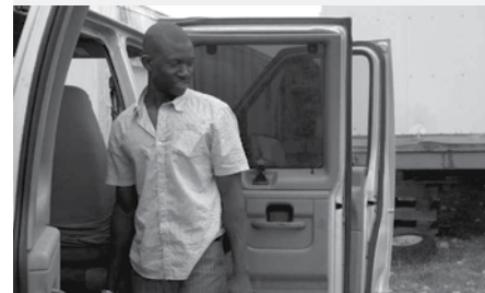
■ Canada 2010, 71 minutes — Réal. : Stéphanie Lanthier — Scén. : Stéphanie Lanthier — Dist. : ONF.