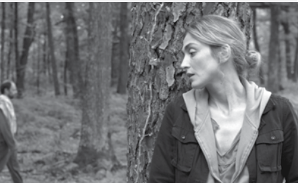
■ France 2009, 103 minutes — Réal. : Xabi Molia — Scén. : Xabi Molia — Int. : Julie Gayet, Denis Podalydès, Constance Dollé, Mathieu Busson — Dist. : A-Z Films.