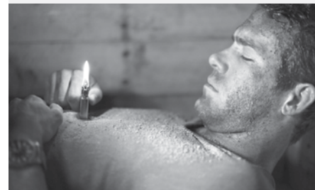
■ ENTERRÉ — Espagne 2009, 93 minutes — Réal. : Rodrigo Cortés — Scén. : Chris Sparling — Int. : Ryan Reynolds, Ivana Mino — Dist. : Equinoxe.