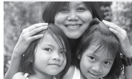
■ Canada 2010, 104 minutes — Réal. : Robbie Hart, Luc Côté — Scén. : Robbie Hart — Dist. : ONF.