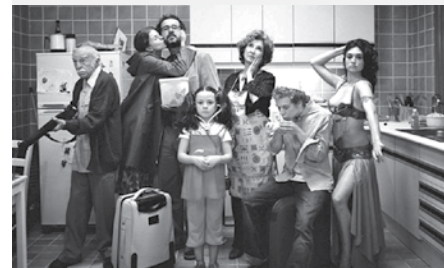
■ France 2009, 102 minutes — Réal. : Éric Toledano, Olivier Nakache — Scén. : Éric Toledano, Olivier Nakache — Int. : Isabelle Carré, Vincent Elbaz, François-Xavier Demaison, Omar Sy, Audrey Dana — Dist. : A-Z Films.