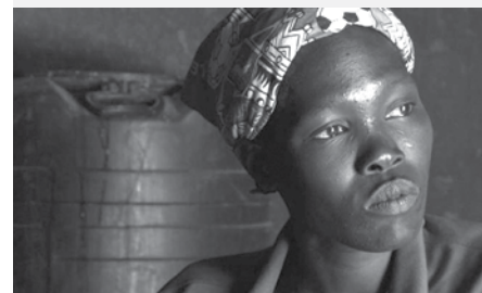
■ GRACE, MILLY, LUCY... DES FILLETES SOLDATES — Canada 2010, 73 minutes — Réal. : Raymonde Provencher — Dist. : ONF.