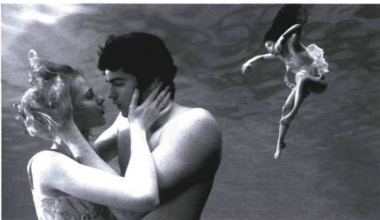
Une inlassable volonté de séduire le spectateur

La cinéaste et dramaturge Julie Taymor propose avec Across the Universe un film hautement conceptuel. Essentiellement, le projet consiste à dresser un portrait de la contre-culture américano-britannique des années 60 au moyen de l'œuvre musicale des Beatles. Le résultat est un pot-pourri improbable des principaux acteurs, événements et clichés des sixties regroupés dans un même espace-temps et représentés sommairement, sous forme de vignettes. Parce que cette décennie a été représentée jusqu'à satiété, la réalisatrice profite d'un riche imaginaire collectif pour couper les coins ronds et naviguer en surface. En effet, le film emprunte sans relâche le raccourci de la citation et de l'évocation; il communique sur le mode du clin d'œil, de l'archétype et, surtout, du stéréotype. Un même ton léger et sympathique, puis une inlassable volonté de séduire le spectateur teintent le long métrage d'un bout à l'autre. Le résultat n'est rien de plus que la relique mignonne d'une époque de chambardements culturels et politiques.