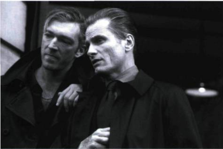
Une relation fraternelle ambiguë

Sollicité de toutes parts depuis que A History of Violence signala sa sortie du placard stylistique, le maître de l'horreur psychologique passait alors à l'ouest du B-movie psychologique, le cinéaste opta sans prévenir pour le scénario de Steven Knight, fort en similitudes avec Dirty Pretty Things , que ce dernier signa pour Stephen Frears. Pour la première fois de sa carrière, Cronenberg mis le pied à l'extérieur du Canada pour l'entièreté d'un tournage, vu le côté anglais du récit de Knight, costaud sarabande sur la mafia russe opérant à partir de Londres.