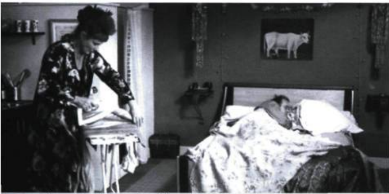
Un constat pessimiste sur la société organisée

Il y a chez Iosseliani un mélange fort attachant : c'est un pamphlétaire revendiquant l'apéro et les copains au lieu de ruminer ses idéaux collectifs. Sans gêne ni ringardise, le bonhomme est néanmoins resté attaché aux revendications post-soixante-huitardes. L'aplanissement des classes sociales est au cœur de ces Jardins en automne légèrement jaunés, qui doivent autant à la période française de Buñuel, tout en « bourgeoiseries » caustiques, qu'aux insolents détours catastrophiques qu'a fait subir Flaubert à Bouvard et Pécuchet .