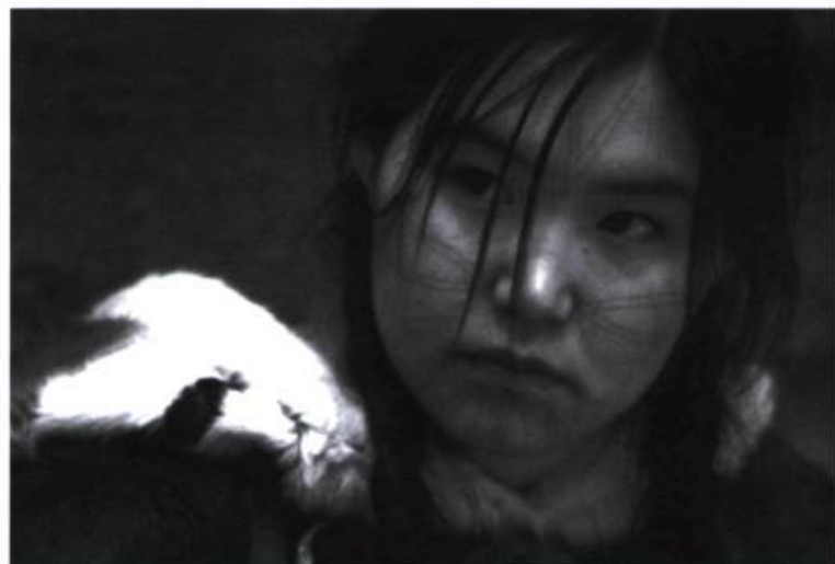
Sous le modèle de l'oralité, le cinéma laisse la place aux interprètes

qualifier d'ethnocide, le récit présente des rencontres ponctuées de rires, de moments d'amitié et de partage. Ainsi, les auteurs ne négligent en aucun point l'intelligence de chacune des ethnies en leur reléguant un certain pouvoir d'autodétermination. Sous le modèle de l'oralité, le cinéma laisse la place aux interprètes, au jeu. Ce qui pourrait être lu comme des lenteurs peut également se comprendre comme des espaces libres de la trame narrative que les voix, les respirations, les lumières viennent remplir. La musique joue en ce sens un rôle central, car, sons de gorge, cris et chants célèbrent la culture inuite et plongent davantage le spectateur dans leur univers si particulier. C'est d'ailleurs ces mêmes chants que devront cesser de pratiquer les nouveaux croyants.