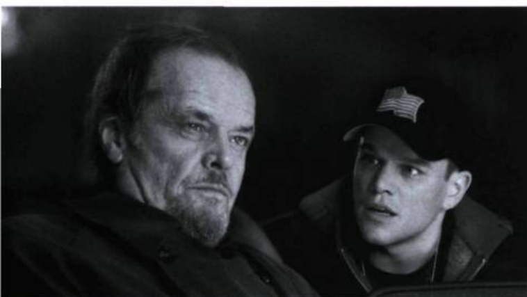
Un film symétrique où se joue le combat du bien et du mal