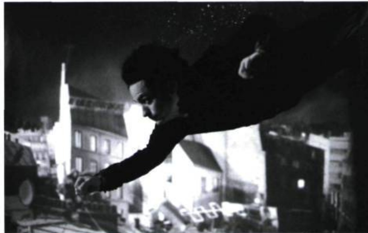
Une vaste opération de déconstruction du réel

Pour répondre dignement à cet état d'esprit, Gondry plonge tête première dans une esthétique très naïve. Gondry, l'éternel enfant (on l'avait remarqué déjà dans ses vidéoclips), a fait de La Science des rêves l'expression d'un imaginaire d'enfant. Les effets visuels, les décors et même le déroulement narratif (l'humour scatologique du personnage d'Alain Chabat) sont en effet typiques d'une imagination dépouillée de toute prétention (et de tout respect) académique. Tout est bric-à-brac,