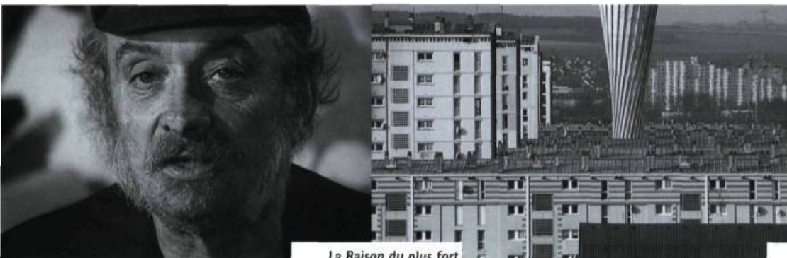
La Raison du plus fort