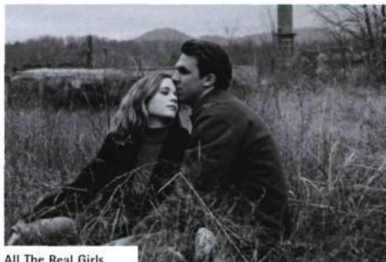
All The Real Girls