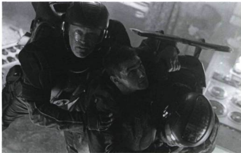
Un discours prophylactique

Tom Cruise incarne dans un futur rapproché le policier John Anderton, premier homme de terrain d'une organisation pilote basée à Washington qui s'appête à prendre une envergure nationale. Aidé de trois adolescents mutants capables de prévoir à l'avance les homicides, Anderton et ses comparses préviennent les meurtres et arrêtent par anticipation les coupables en devenir. L'utopie pastorale dérape lorsque Anderton lui-même est identifié comme futur meurtrier. Spielberg injecte à cette prémisse sa propre touche (grasse et généreuse) et développe une intrigue moins compliquée qu'il n'y paraît, tout juste assez solide pour jus-