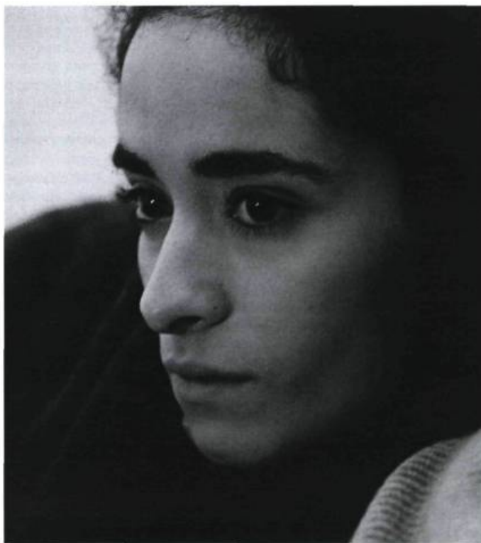
Le besoin d'affirmation

Sans doute afin d'éviter que son film-brûlot ne se transforme carrément en pamphlet, Serreau ouvre grand la porte ici à un traitement filmique burlesque et parfois même caricatural.