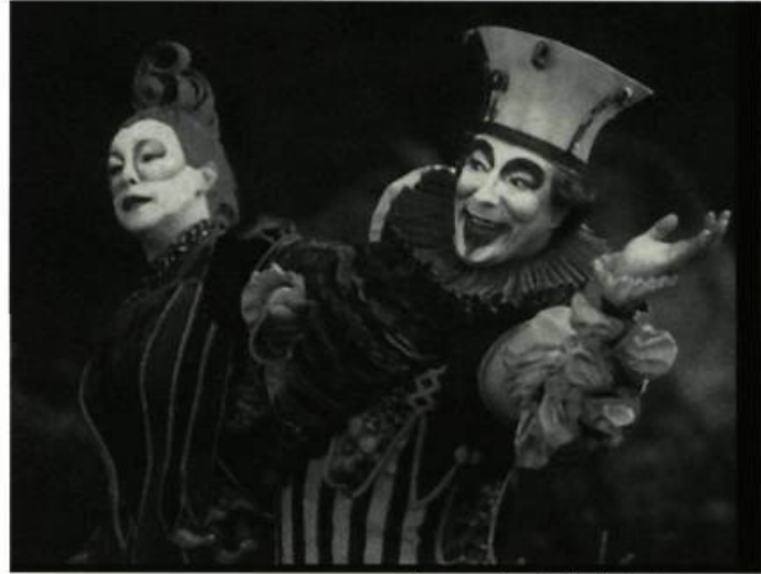
La rencontre des instincts clownesques