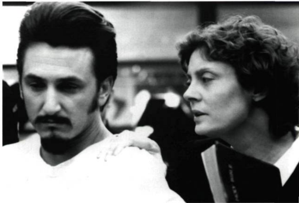
Sean Penn et Susan Sarandon

problématique, en recueillant, par le biais du personnage de la religieuse, les témoignages déchirants des parents des victimes, ceux de la mère du condamné ainsi que les commentaires du bourreau.