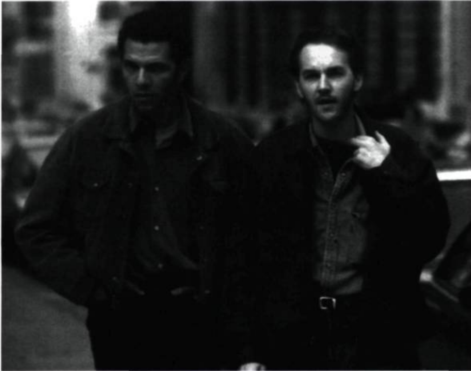
Roschdy Zem et Xavier Beauvois

Les soubresauts de cette psychologie mise à feu et à sang, en quête d'une sortie de secours, sont traqués par une caméra qui, à l'image du héros, se permet toutes les audaces. Dans la spirale décadente qui aspire Benoît pendant la première heure du film, deux temps forts se répondent dans l'écho complémentaire du sexe et de la drogue. Une première scène se passe à Paris dans l'appartement d'Omar, l'initiateur de tous les plaisirs. Sur une durée quasiment réelle, le rite du shoot est disséqué dans tous ses détails pratiques, jusqu'à l'orgasme pathétique. La séquence est traitée avec une précision proche du documentaire, une franchise et un réalisme rares dans le cinéma de fiction, surtout pour un sujet aussi délicat. En même temps que Benoît, le spectateur est initié, rendu profondément complice grâce à la proximité des plans et à la dilatation du temps. La lumière crue qui accompagne cette descente aux enfers achève de le transporter dans l'atmosphère oppressante de cette extase glaciale. Quelques minutes plus tard, même pas le temps de se remettre du choc, cette scène trouve son pendant avec le long plan séquence de sexe à trois dans un bordel d'Amsterdam. De manière extrêmement explicite, le réalisateur filme le cul dans toute sa crudité, dans tout ce qu'il peut avoir de désespéré et supposer de désillusion et de ridicule. Le décor