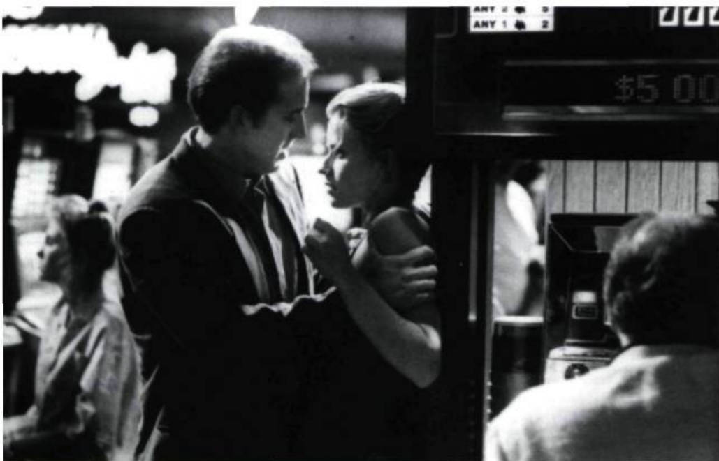
Nicolas Cage et Elisabeth Shue

Un romantisme fébrile imprègne cependant les situations dans lesquelles sont plongés les deux personnages principaux. Ce sont des écorchés certes, mais dont la passion est en veilleuse. Pour chanter la beauté des visages et des mouvements, Figgis a choisi des comédiens remarquables. Dès que Nicolas Cage jongle avec le magnétisme qui lui est propre, la fascination est totale. Chef d'orchestre de son propre opéra tragique, l'acteur a su pousser son personnage dans une véritable impasse paroxystique. Il semble improviser chaque réplique, inventer chaque fois le geste adéquat sans référence réelle à un scénario préétabli, mais en suivant docilement et subtilement les mouvements de l'âme saisis dans leur désarroi le plus profond. C'est autour de lui que s'organise un petit réseau de correspondances secrètes où vient s'inscrire l'admirable Elisabeth Shue, à qui on souhaitait depuis longtemps un rôle comme celui-ci. Son personnage s'amarre consciemment au radeau de Ben et le jeu de la comédienne s'apparente à celui des grandes actrices tragiques des années 40. Par son regard d'oiseau perdu, comme ensorcelé par l'affrontement qu'elle a choisi d'assumer, par son corps, un corps rêvé livré à un absurde délire autodestructeur, l'actrice exprime avec force une succession de sentiments contradictoires et s'en tire avec éclat.