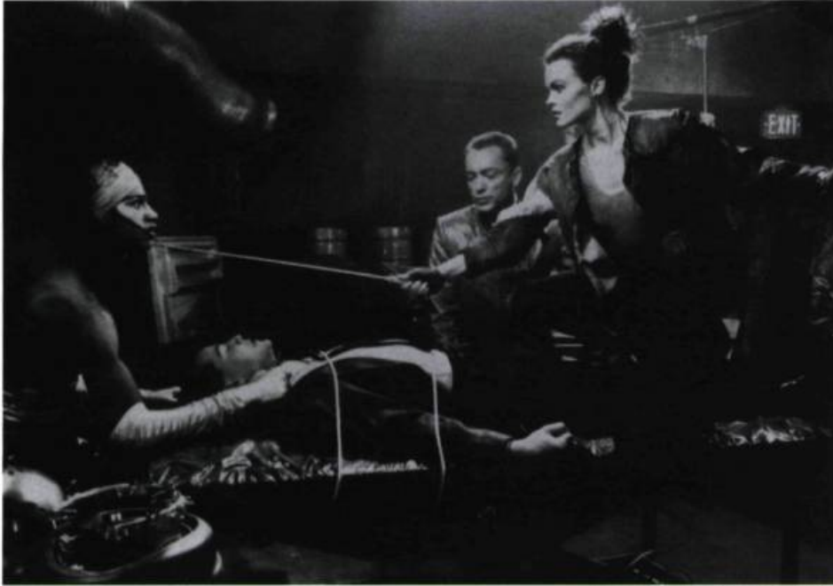
Keanu Reeves dans Johnny Mnemonic