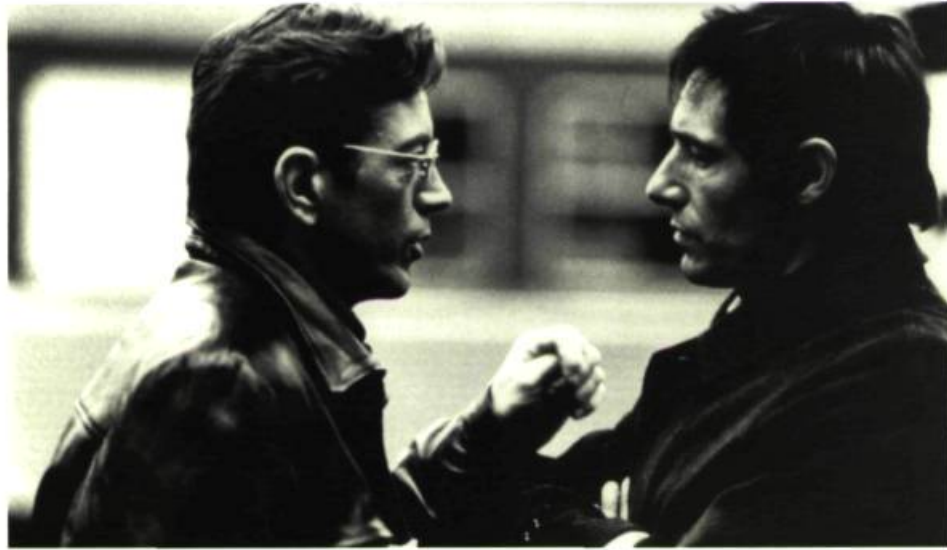
Bernard Giraudeau et Gérard Lanvin

À travers le portrait émouvant de chacun de ces hommes, de leurs failles et de leurs douleurs, Nicole Garcia dépasse l'histoire personnelle et intimiste, et déborde sur des sujets bien plus universels: les conflits de générations, l'ascension sociale, la marginalité sexuelle, les jalousies... et surtout, la difficulté d'assumer ses origines, comme celle d'assumer de ne pas en avoir. Dans tous les problèmes relationnels qui jalonnent les existences de ses personnages, elle se garde bien de prendre un parti manichéen: dans son film, il n'y a ni bons ni mauvais; il y a simplement des fai-