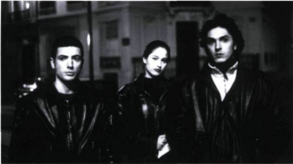
Bruno Putzulu, Marie Gillain et Olivier Sitruk

le rythme. Il s'adresse à notre sensibilité et à notre compréhension en s'attardant plus longuement afin de mieux tracer un portrait psychologique de la profonde détresse de ces jeunes laissés à eux-mêmes. De ces éternels adolescents qui sont finalement d'une ignorance et d'une inconscience à faire pleurer.