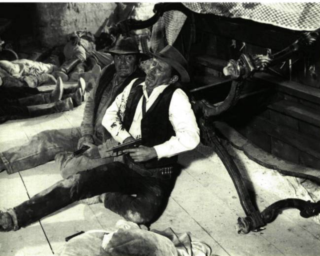
Ernest Borgnine et William Holden

aucun doute de démythifier le western sentimental avec tous ses nobles héros. Il réussit à détruire le mythe, mais avait-il besoin pour le faire d'être si violent?»