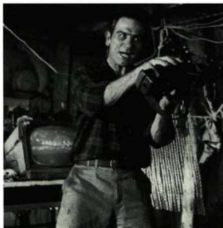
Jones dans Blown Away