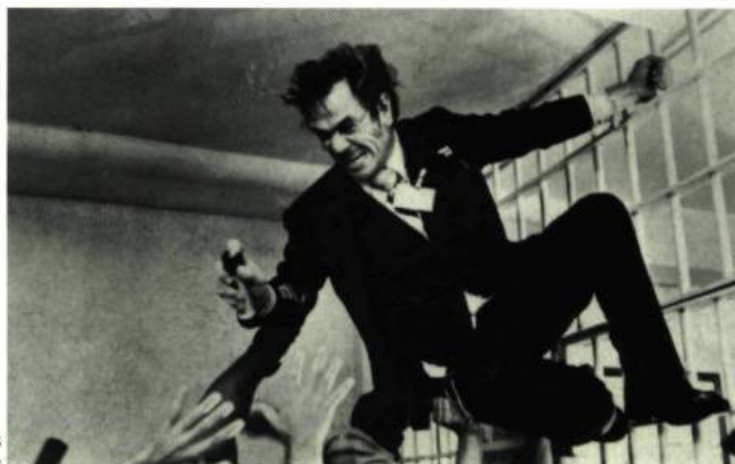
Jones dans Natural Born Killers