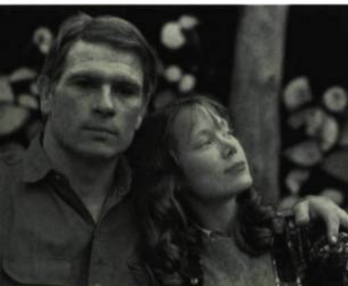
Jones et Sissy Spacek dans Coal Miner's Daughter

Tommy Lee Jones, c'est déjà une petite, très petite consécration. C'est l'époque où on le voit (quatre ans durant) dans «One Life to Live», mélo d'après-midi très couru à l'époque. Et aussi dans l'émission-pilote de «Charlie's Angels» avec Farrah Fawcett, Kate Jackson et Jaclyn Smith.