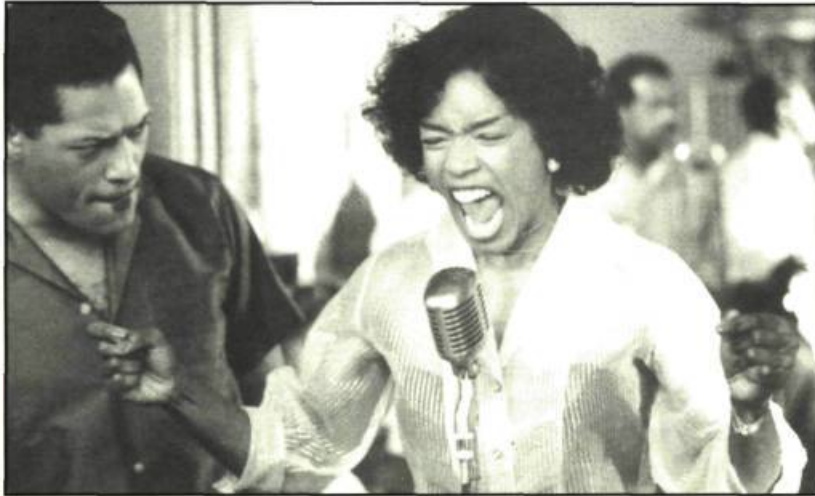
Laurence Fishburne et Angela Bassett