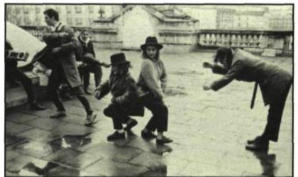
Une scène de Tango

Tango est une oeuvre intéressante parce que délibérément engagée. Pas une seule réplique qui ne fasse ricochet, pas un seul geste qui n'ait son poids de sous-entendus. Dans le tourbillon des insurrections sociales actuelles, démythifiant joyeusement une bonne quinzaine d'idées-tabous sans facilités ni aucun maniérisme technique, Patrice Leconte brosse un vigoureux tableau des relations amoureuses, qui s'achève sans doute par un happy-end légèrement télécommandé, mais qui décoche en passant de solides coups de boutoir au