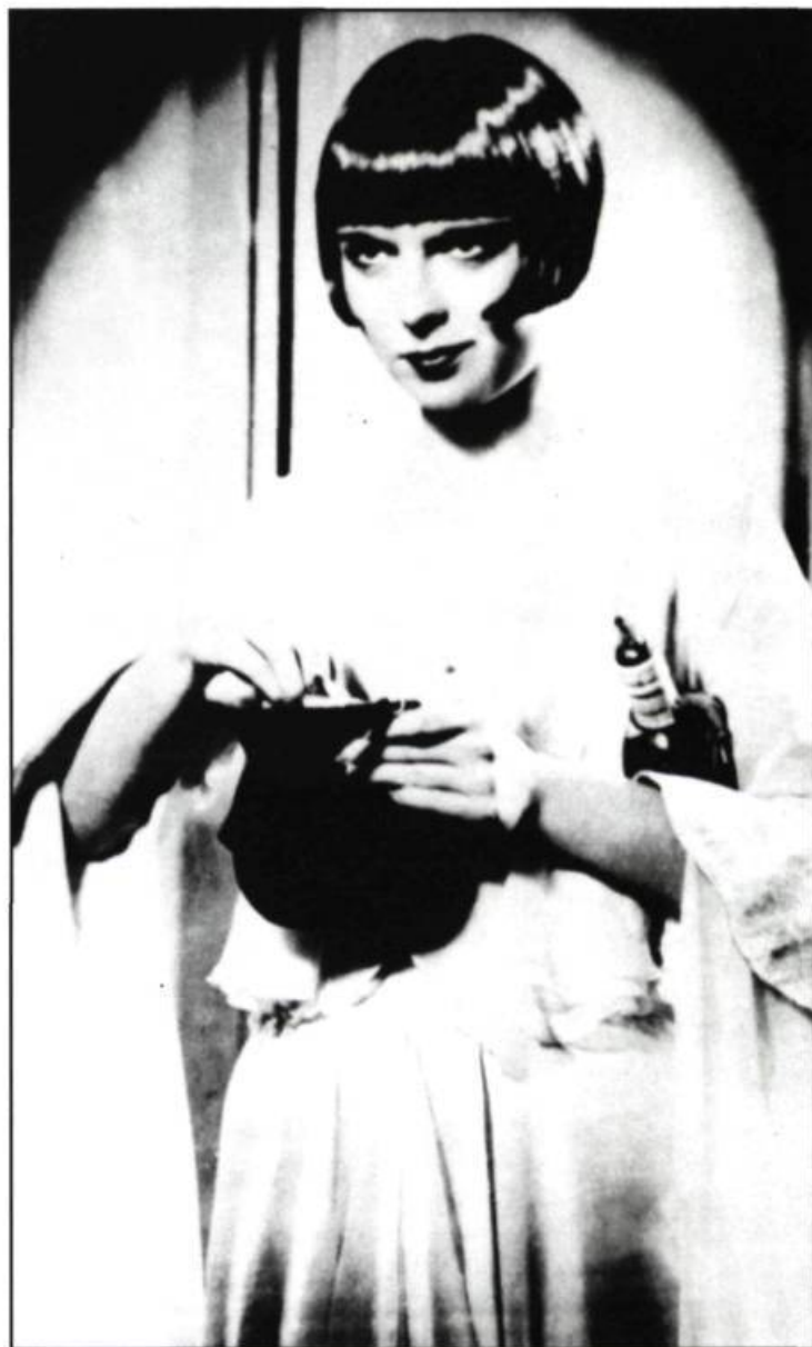
Louise Brooks dans Loulou

— C'est ce que je préfère de Pabst. Nagy et Pabst se connaissaient, tout en parlant peu de leurs films. Après le courant expressionniste, lui et Nagy ont poussé très loin leurs recherches de l'esprit de Bauhaus, de la ligne droite, simple, mais sans la sécheresse qu'on reproche parfois aux fondateurs du Bauhaus. Pabst ne voulait pas qu'une source de lumière vienne d'un côté inattendu de l'action. S'il y avait une fenêtre, la lumière venait de la fenêtre. Dans les films expressionnistes, la lumière pouvait venir d'en bas, sous les pieds. Le contemporain Fassbinder, lui, a poussé très loin ce réalisme social, comme dans Berlin Alexanderplatz . Un film ne vieillit pas si on a utilisé tous les moyens techniques disponibles, et si cette technique a été entièrement exploitée pour transmettre le message qu'on voulait faire passer. C'est le cas de Kameradschaft . La construction narrative de Kameradschaft est forte et je suis toujours étonné de voir le