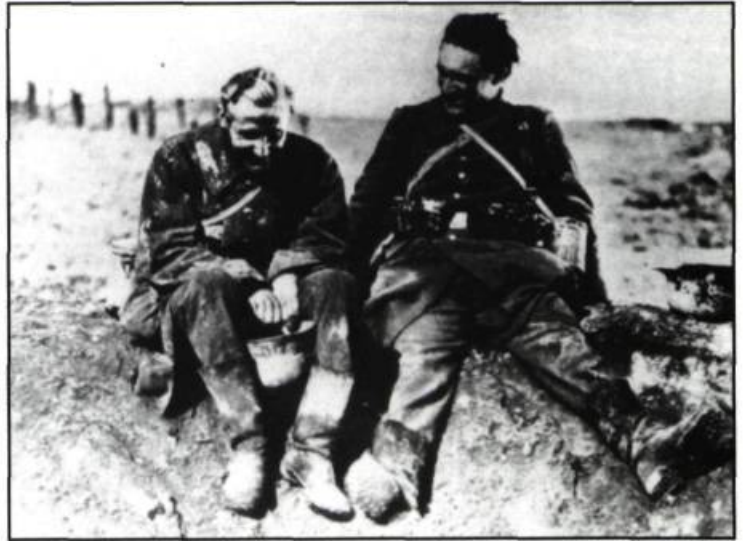
Quatre de l'infanterie

— Le début du malentendu entre Brecht-Weill et Pabst a commencé à la réunion de production portant sur le scénario. C'était une réunion où Béla Balsazs et les autres scénaristes étaient présents. Pabst disait : «Pour moi, c'est un conte moderne, une «fairy tale»...» Furieux, Brecht répliquait que c'était au contraire un film historique, réaliste,