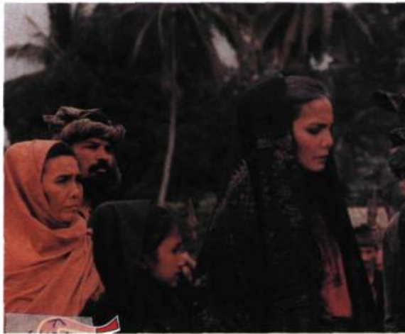
Tjoet Nja'Dhien d'Eros Djarot

En fait, ce qui rend mémorable le cru 1989 de cette section du Festival international du film, plus que le choix des films, dont nous parlerons un peu plus loin, c'est l'origine de certaines oeuvres. Ainsi, la Semaine a été inaugurée par une superproduction indonésienne — une première dans les 42 ans de Cannes, alors que l'Indonésie produit quelque 140 films par an! — Tjoet Nja'Dhien , d'Eros Djarot qui s'est d'abord fait un nom dans son pays comme chanteur et comme compositeur de musique de films. Il s'agit d'une grande fresque historique retraçant les affrontements entre les Pays-Bas et le Sultan d'Aceh et les hauts faits de Tjoet Nja'Dhien, l'épouse de ce dernier, qui a pris en main l'insurrection après sa mort en 1899 et a poursuivi