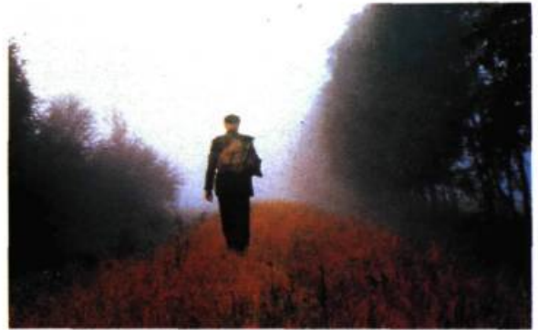
Le Dernier Voyage de Waller de Christian Wagner

On a aussi malheureusement sombré dans la banalité: quel intérêt a-t-on trouvé à Walters Letzer Gang/Le Dernier Voyage de Waller , de l'Allemand de l'Ouest Christian Wagner? Waller, un ancien contrôleur de voie de chemin de fer, marche tout au long de ce film sur une voie ferrée (tiens, donc!), en revoyant divers moments de son existence et en pensant à une femme aimée, mais non épousée à cause de certaines conventions sociales. Rien de bien neuf là-dedans, hélas! Montalvo et l'Enfant , une production française réalisée par Claude Mourieras, aurait fait un excellent court métrage et sa durée de 75 minutes a permis de mieux comprendre ce à quoi ressemble l'éternité. D'une rare complaisance, mais avec un seul atout, sa superbe photographie en noir et blanc, on y traite de tauromachie, de l'égorgeage d'un agneau et de danse: le tout sans grand lien apparent.