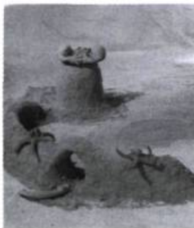
Le Château de sable [1977]

C'est cette réussite qu'il faut être certain d'analyser, au cas où nous aurions besoin de la répéter demain matin peut-être.