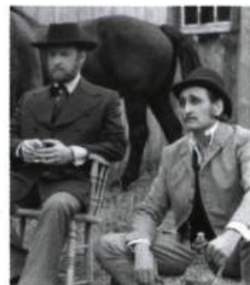
J.A. Martin photographe [1976]