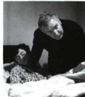
Mon oncle Antoine [1971]