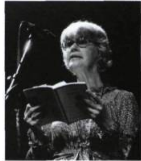
La Nuit de la poésie [1970]

Il y eut ainsi à l'origine du cinéma canadien deux actes d'héroïsme.