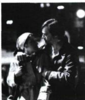
Mourir à tue-tête [1979]