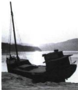
Les Voitures d'eau [1968]

Mais ils avaient trouvé un terrain commun. C'était tout de même improbable. Les actes d'héroïsme le sont souvent. De même, les paris stupides!