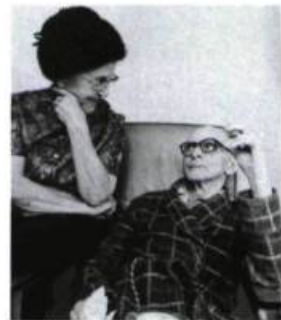
Au bout de mon âge [1975]