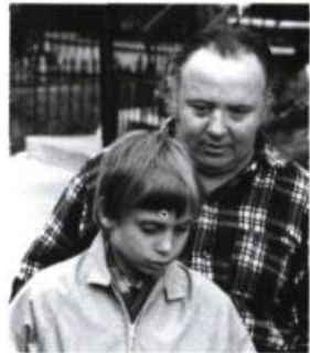
Le Temps d'une chasse [1972]