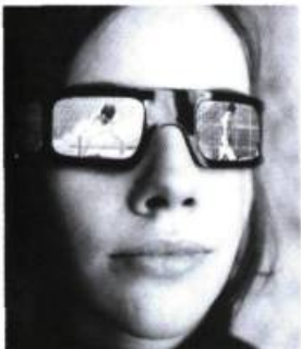
Entre tu et vous [1969]