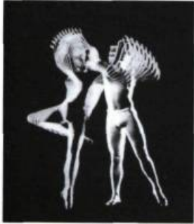
Pas de deux [1967]

Et puisqu'on parle cinéma, aller au cinéma, à cette époque, c'est aller voir un film américain (fatalement,) suivi d'une apparition de la Reine chevauchant en amazone un destrier nommé Winston (?), au son du God save the Queen . Dans les allées, les mauvais citoyens filent comme des rats vers la sortie, pour éviter de se mettre au garde-à-vous.