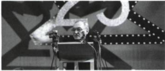
John Grierson au 25e anniversaire de l'O.N.F.

dire pas. Que l'O.N.F. disparaisse à la fin de la guerre et on ne saura jamais si c'est une perte majeure ou insignifiante.