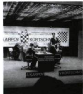
Jouer sa vie [1982]