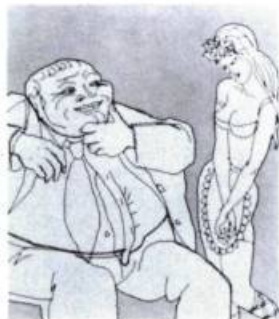
La Faim (1973)

Le premier, — puisqu'il faut improviser des cinéastes —, consiste à construire la couveuse d'abord, en espérant que les poussins viendront s'y installer. Cette façon de faire parut étourdissante de libéralisme, à l'époque. Elle eut été impensable en Europe, où il fallait qu'une activité culturelle soit reconnue d'utilité publique depuis vingt ans avant qu'on l'installe dans ses meubles. Au Canada, le cinéma, tout neuf, démarre de façon spectaculaire. Non! Mieux: grandissime!