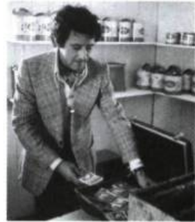
La Gammick [1974]

Pourtant, le résultat net, c'est que vingt ans plus tard le cinéma canadien a pris une avance considérable sur les autres arts, et une avance considérable sur le cinéma d'autres pays comparables.