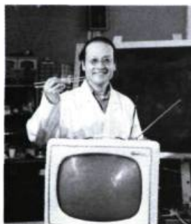
L'Affaire Bronswik [1978]

Mais mieux encore: en 1940, non seulement la ligne à suivre est toute tracée, mais on n'a rien à perdre. Le cinéma n'existe pour ainsi