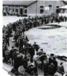
Gui Dao: sur la voie [1980]

Il n'y a pas de vertu particulière à avoir cinquante ans; mais si ce premier demi-siècle a laissé quelques bastions culturels éprouvés, ou, au moins, un premier terreau authentique, ces cinquante années auront eu une vertu particulière et, à nous tous, nous aurons peut-être fait plus que nous le croyions.