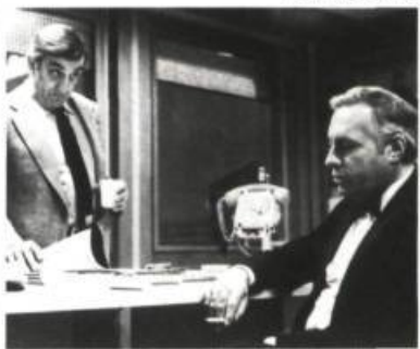
Garde à vue

— Je sais qu'aujourd'hui le mot est déformé. Si on me pose la