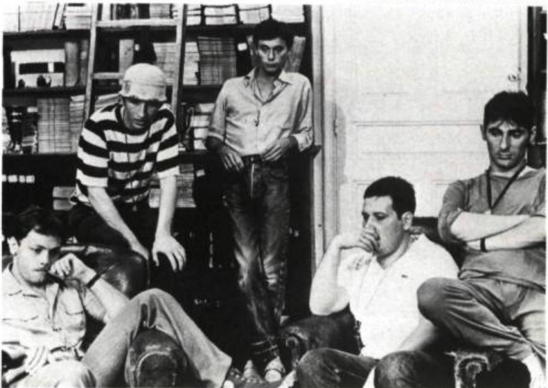
La Meilleure Façon de marcher

— Il s'agit de trouver un sujet d'intérêt pour les deux collaborateurs. Travailler ensemble, cela veut dire beaucoup de discussions préalables pour aboutir plus ou moins ensemble à une structure dramatique. Par contre, à partir du moment où la structure