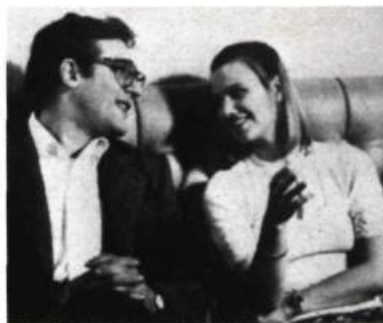
Dites-lui que je l'aime

— Le public a-t-il répondu à votre attente: autant par l'assistance que par la compréhension?