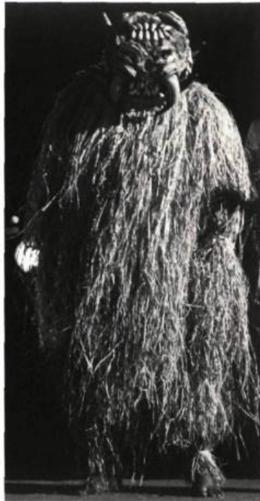
Les Démons apprivoisés

— Dans mon film, je montre la création d'un environnement