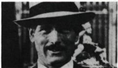
Fort Apache, the Bronx