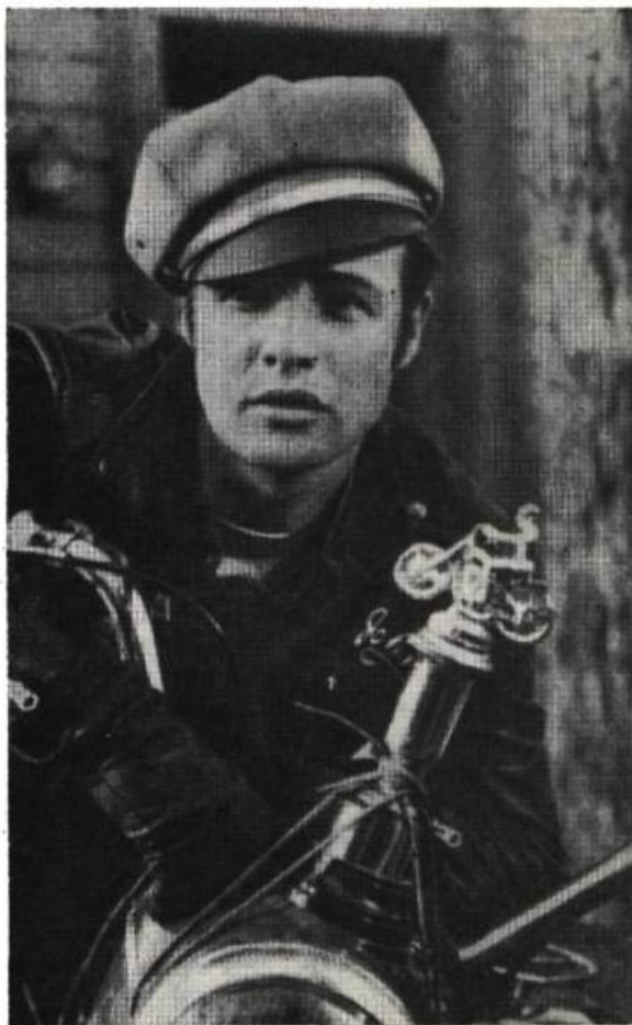
Marlon Brando dans The Wild One

« investissement » de la personne qu'Eisenstein, très loyalement, considérait comme une des fonctions essentielles du cinéma. Dans ces perspectives, on peut se demander si tout le cinéma russe, de Poudovkine jusqu'à Tchoukrai ne souffre pas de ces tares psychologiques autant qu'esthétiques : esprit de lourdeur, schématisme, raidissement moral, substitution de l'illustration à l'expression. A la limite, un certain viol mental du public serait le commun dénominateur de la production soviétique, du cinéma hitlérien, de la machine à rêves de Hollywood. Dans ces trois cas, en donnant aux mythes personnels ou collectifs, érotiques ou politiques, un degré de présence aussi écrasant que possible, on pousserait à ses possibilités extrêmes tout ce qui dans le septième art permet d'imposer quelque chose. Inutile d'insister