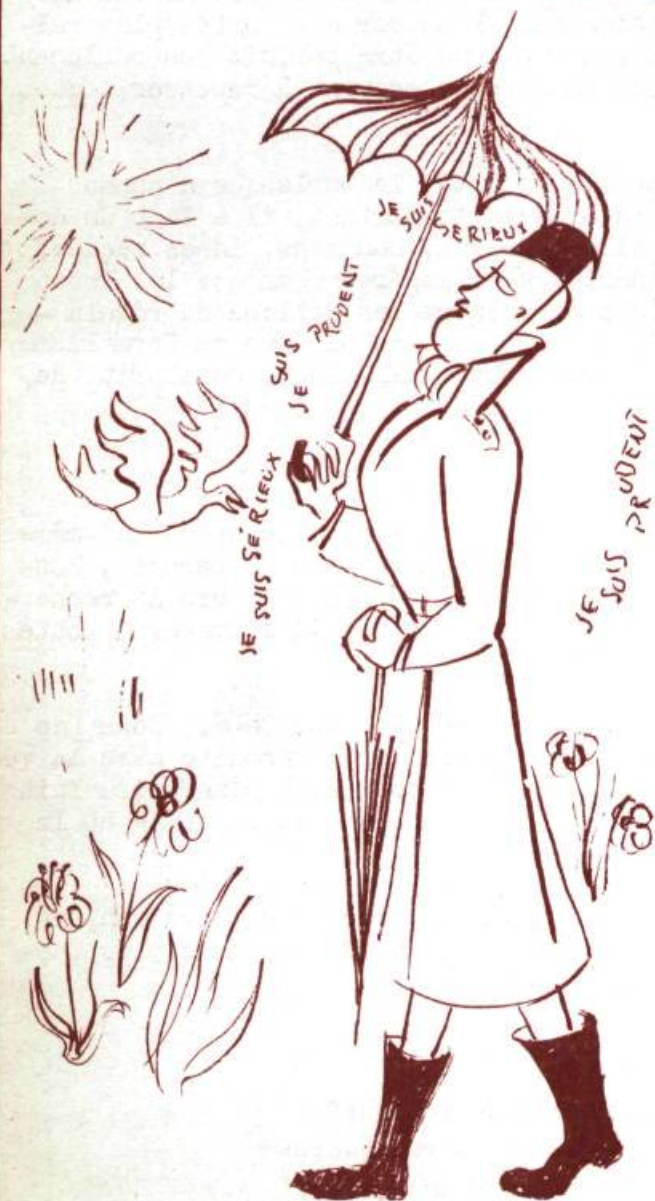
... DE CARACTÈRES