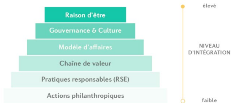
Figure 2 – Niveaux d'intégration de l'impact sociétal d'une entreprise

sociétal au sein de l'entreprise. Ce type de réflexion à intégrer l'impact sociétal dans sa démarche entrepreneuriale ou encore la transformation de son entreprise s'avère un avantage concurrentiel non négligeable, pourvu que l'organisation puisse mesurer et communiquer cet impact.