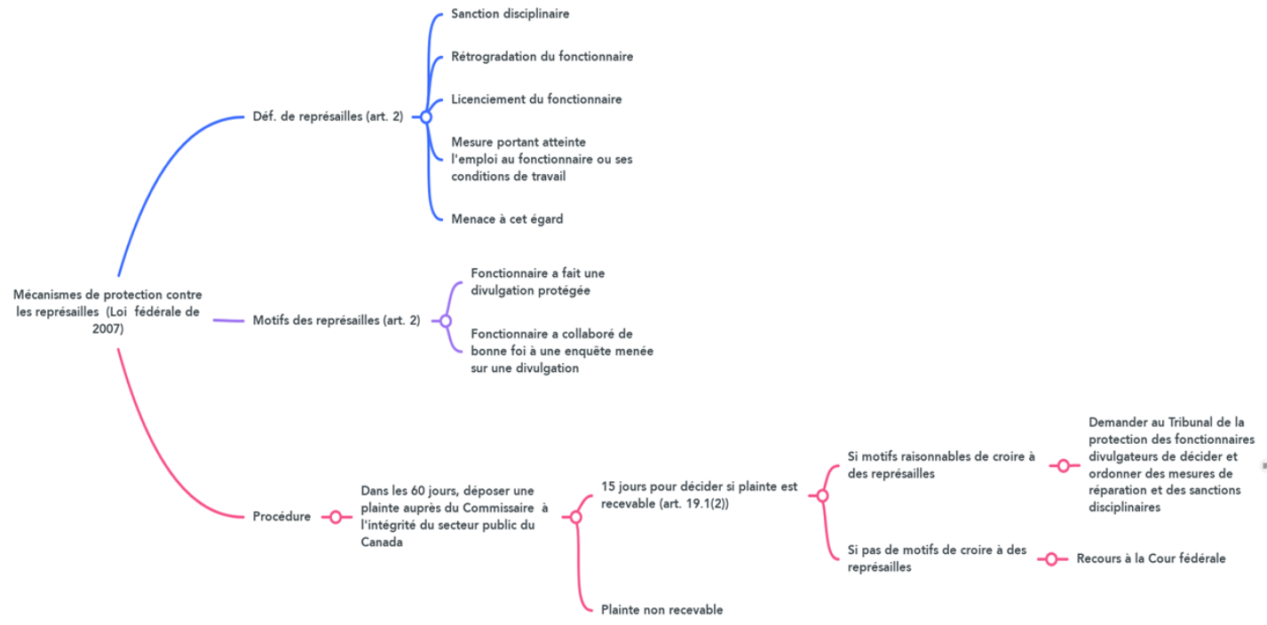
Schéma des mécanismes de protection contre les représailles de la LPFDAR de 2007