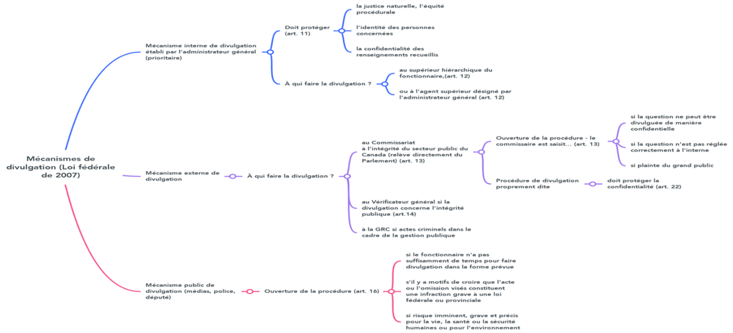
Schéma des trois canaux pour divulguer un acte répréhensible prévu dans la LPFDAR de 2007