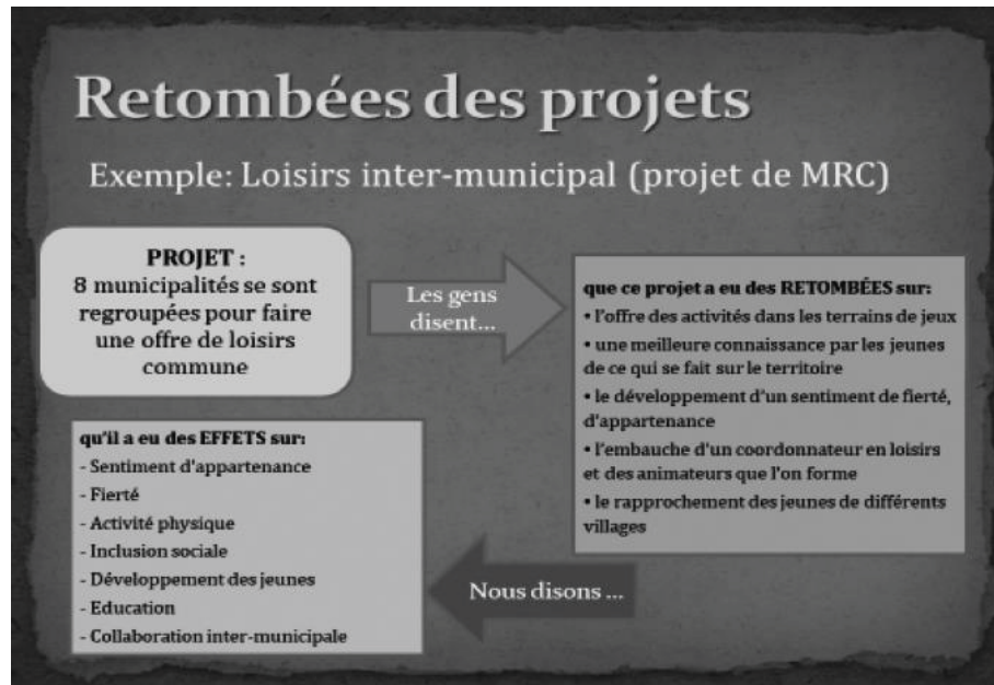
Figure 3 – Exemple : Le loisir intermunicipal (projet de MRC)