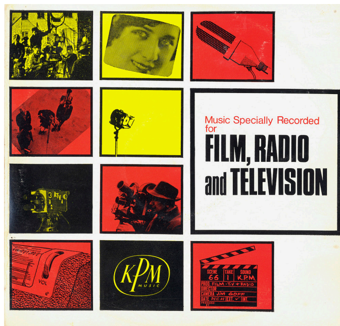
Figure 1 : Pochette générique d'un album publié par la librairie musicale KPM entre 1966 et 1968.