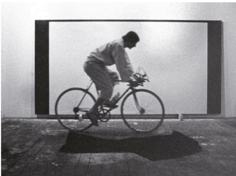
Figure 4 : Extrait du film Le Son d'un espace de Charles Gagnon, 1967-68, Canadian Filmmakers, Distribution Centre, Toronto.

Tableau et écran forment un seul et même espace. Charles Gagnon fait lui-même cette association lorsqu'il décrit son film : « Mes tableaux ressemblent beaucoup à des écrans de cinéma par leur forme et les bandes noires qui les délimitent. Il m'est aussi apparu évident que ce qui se passait à l'extérieur de l'écran était, d'une certaine façon, aussi important que ce qui se passait sur l'écran » (Gagnon dans ibid. , p. 92). La référence à la peinture comme écran apparaît dans ses œuvres au début 1960, que ce soit par des espaces qui s'emboîtent les uns dans les autres ou des motifs de la fenêtre et de la boîte : The Window (Box No. 6) (La Fenêtre) (1962), Inside Out (1963), Double Time/Space Blind (1965), Gray Field/Champ gris (1965-1966) et The Sound (1966). Au cours de ces années, l'écran se superpose également à la peinture, comme les titres d'une série réalisée en 1966 le mettent en évidence : Espace écran avec espace aveugle, blanc (1965) ; Espace écran avec espace aveugle, rose (1965) ; Espace écran avec espace aveugle – rouge ocre (1966) ou Espace écran – blanc (1966). En 1967, des bordures noires commencent à apparaître dans Étapes de novembre ou encore avec ( Étapes ) Décembre , l'année suivante, en 1968-1969. Les bordures noires accentuent l'amplitude de l'écran à l'intérieur de la peinture.