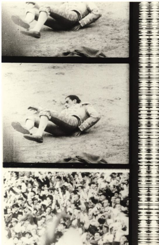
Figure 3 : Extrait du film Le Huitième Jour de Charles Gagnon, 1967, Pavillon chrétien, Expo 67, Canadian Filmmakers, Distribution Centre, Toronto.

s'achever sur une explosion atomique (figures 2 et 3). Une autre particularité du montage est la présence répétée d'explosions qui rythme le temps et semble être un des leitmotifs du film. Seules quelques images ont été commandées au photographe montréalais John Max afin d'exposer en alternance des accumulations de choses, telles que des automobiles, des cimetières, des quincailleries et des épiceries (Gagnon cité dans Kin Gagnon 2009, p. 33), et des photographies trouvées dans les archives représentant des corps empilés difficiles à regarder. Charles Gagnon laisse les archives parler d'elles-mêmes. Il mentionne ne pas avoir retouché les documents sauf pour animer quelques photographies avec une caméra Bolex et un zoom « pas cher » (Gagnon dans Fry 1978, p. 90).