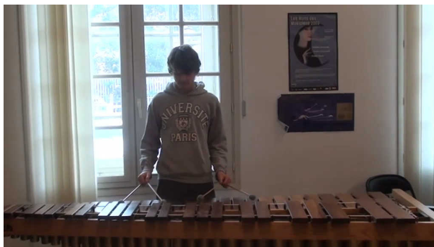
Extrait vidéo 2 : Exercices techniques à travers le « Canon de Pachelbel ».

Grâce au logiciel, les élèves peuvent découvrir et apprendre à jouer de nombreux styles de musique qui se divisent en trois grandes catégories : jazz, latin et pop. L'acquisition du logiciel donne également accès à des forums où l'on peut télécharger d'autres pièces s'inscrivant dans d'autres styles musicaux (classique, brésilien, fusion, rock, etc.) et pouvant être jouées dans un style jazz, latin ou pop.