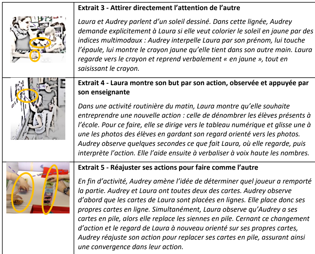
Figure 3. Différentes manières d'attirer l'attention de l'autre pour obtenir son attention conjointe et orienter conjointement leurs buts/coordonner l'action.

figure 3 illustre trois manières pour Audrey et Laura de combiner différents indices pour ajuster leur attention conjointe lors de différentes activités à table, que ce soit en tête à tête ou dans une activité de groupe. Plus spécifiquement, l'extrait 5 montre comment il est parfois nécessaire de réajuster les actions pour garantir que l'attention conjointe des deux participantes soit alignée sur les mêmes buts, permettant ainsi d'entreprendre une action partagée.