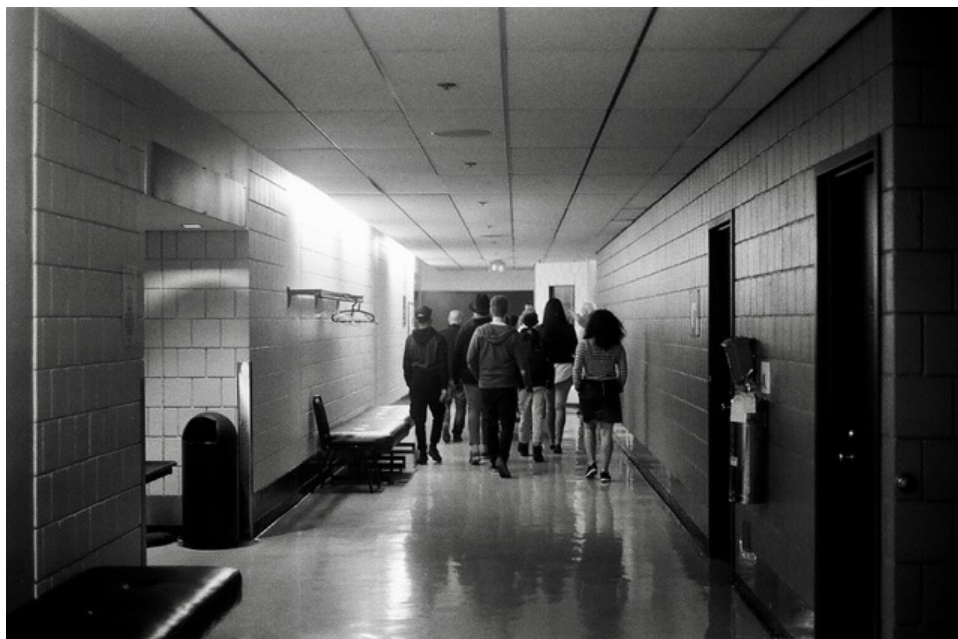
Extraits de Beauchemin, William et Ramos, Sofia. 2016. Devis de recherche. Laboratoire Culture Inclusive. Exeko.

Ce format narratif et quasi-dialogique s'éloigne ainsi en bonne partie des conventions académiques, tout en choisissant d'en adopter certaines approches, par exemple de recherche-crédation. Une partie des motivations qui a poussé à l'adoption de ce format réside dans la volonté de rendre accessible le contenu et des concepts dans un contexte où différents acteurs sociaux sont amenés à le consulter. Cette forme d'hybridation peut sans doute éveiller la curiosité et permettre une plus grande réception auprès d'acteurs et d'actrices du milieu culturel et d'organismes communautaires. La mise en récit fluidifie la compréhension des enjeux de la recherche, en l'inscrivant dans le format d'une histoire racontée. Il faut toutefois remarquer que la difficulté à catégoriser le document rend aussi plus ardu pour les personnes de se l'approprier depuis leur position socioprofessionnelle.