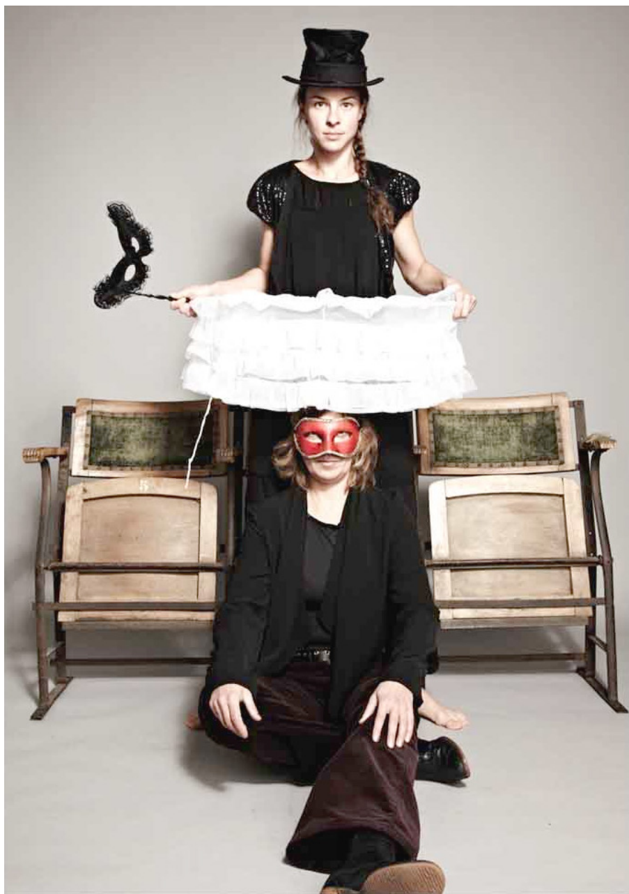
I am the fruit of your imagination (photo et mise en scène : Valérie Frossard).