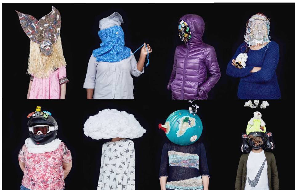
Autofictions (photos et mises en scène : Valérie Frossard).

Il prend ensuite une photo de cette scène avec l'aide d'une animatrice socioculturelle et photographe professionnelle. La séquence est filmée, ce qui permet de recueillir l'ensemble de l'échange entre enfants et jeunes et de la construction de la mise en scène sur la participation qui est ensuite co-analysée avec les mineurs, la photographe et une animatrice socioculturelle/chercheure.