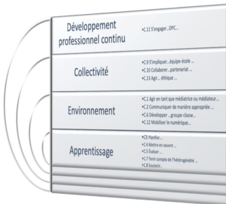
Figure 2 : Compétences associées aux schèmes de l'agir professionnel enseignant en situation

Les invariants opératoires identifiés sont le développement professionnel continu, l'engagement et la profession enseignante. Les possibilités d'inférences se rapportent à la mise en œuvre des moyens propres à assurer l'actualisation et le développement de ses compétences professionnelles (C.11.2). La figure 2 ci-dessous illustre les compétences associées à chacun des schèmes de l'agir professionnel enseignant en situation.