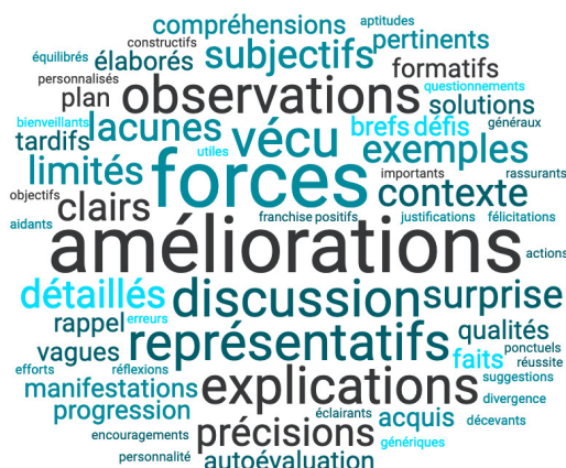
Figure 3 : Synthèse des idées exprimées par les stagiaires liées aux commentaires écrits par les personnes formatrices