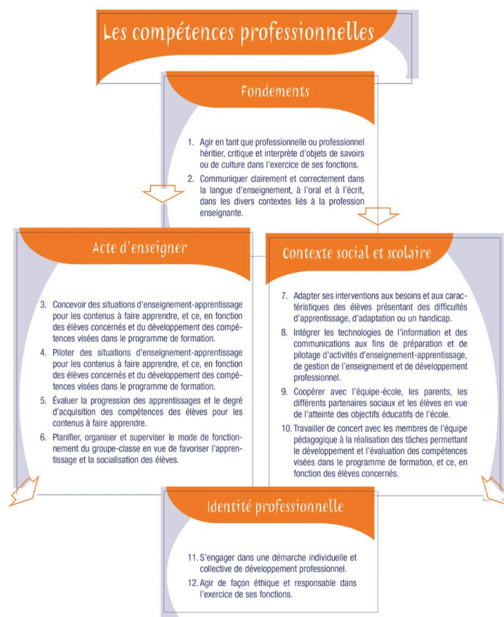
Figure 1 : 12 compétences professionnelles organisées en 4 catégories (MEQ, 2001, p. 59)

La dimension formative de l'évaluation se repère par deux caractéristiques présentes dans une grille. La première caractéristique concerne l'espace accordé aux commentaires dans le document. La deuxième caractéristique correspond aux types de commentaires demandés. Ces caractéristiques témoignent de la prise en compte, d'un point de vue théorique, de la dimension formative par les concepteurs d'une grille d'évaluation en stage.