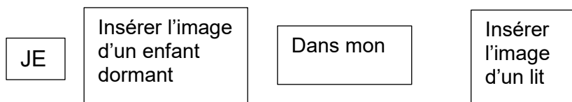
Figure 2 : Exemple d'activité en lien avec l'écriture

Parmi les exemples de stratégies possibles, l'enseignante peut aussi faire imprimer ces mots « étiquettes », les plastifier et faire des jeux d'association entre les mots étiquettes et d'autres mots représentés en image pour créer des phrases (voir exemple dans la figure 2 ci-dessous). Ces jeux peuvent être réalisés dans différents contextes, à l'école comme à la maison.