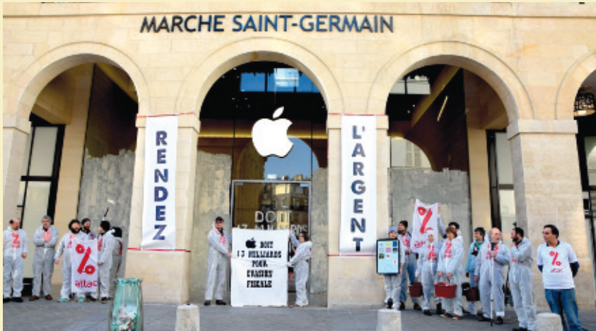
Les militants d'Attac lors d'une action contre une boutique Apple à Paris, le 13 mars 2018.