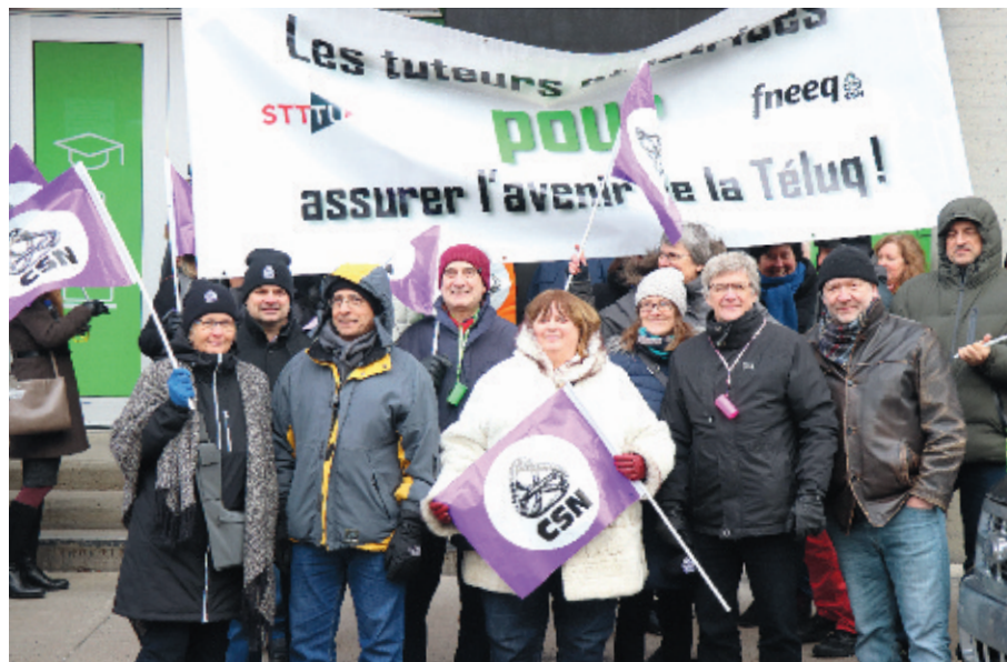
Manifestation des tuteurs et tutrices contre la vague de précarisation et de privatisation à la TÉLUQ, le 7 décembre 2017, devant le siège social de la Télé-université à Québec.

On parle depuis bon nombre d'années des dangers de la marchandisation de l'éducation, c'est-à-dire de la transformation des institutions d'enseignement supérieur en entreprises à but lucratif au service de clients à fidéliser. Ce discours s'accompagne d'ordinaire de l'idée d'assurance-qualité, de concurrence entre les universités pour attirer les meilleurs, d'adéquation formation-emploi et, plus largement, de la recherche comme