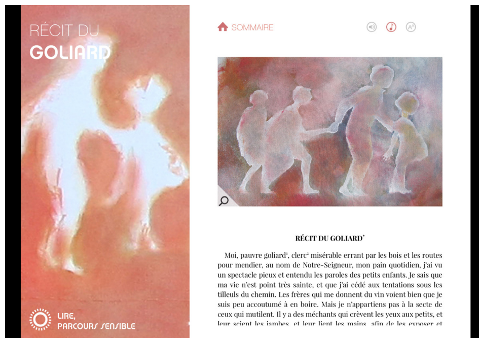
Disposition de l'icône « sommaire » sur la page