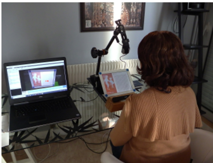
Dispositif d'enquête en condition Laboratoire (LOUSTIC)

L'objectif de l'enquête était avant tout de comparer la réception de la version enrichie par rapport à la version numérique non enrichie. L'étude a été réalisée entre 2018 et 2020 auprès de 44 étudiants, 36 femmes et 8 hommes, issus des filières lettres et métiers du livre du département. Les variables de l'échantillon ont été contrôlées par le laboratoire LOUSTIC 9 . Les étudiants, assignés aléatoirement à l'une des deux conditions expérimentales, lecture de la version enrichie (23 testeurs) ou non enrichie 10 (21 testeurs), ont exploré le livre en condition de laboratoire. Le lecteur était libre d'interagir avec la tablette et aucune indication ne lui était fournie en dehors de la consigne de lire l'incipit puis les deux premiers chapitres de La Croisade des enfants , sans condition de temps.