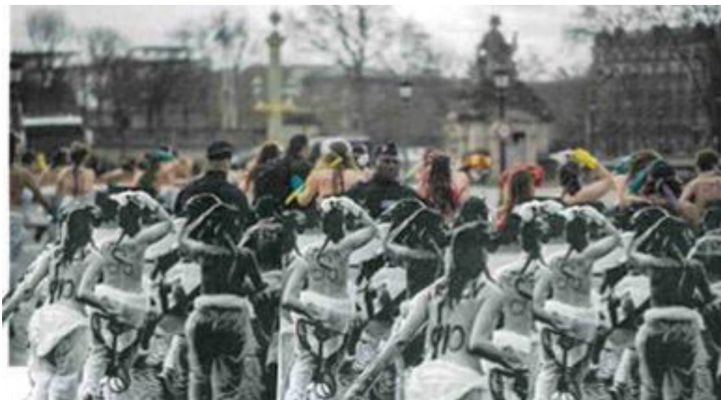
Figure 3. Création de Samuel, élève de 3 e .

Le dernier aménagement de la sémiotique sociale que j'ai développé est l'atelier graphique, mis en place à l'issue des séances. Les adolescents ont été invités à modifier l'image pour la faire correspondre à leur interprétation. Ils ont pu la manipuler avec des outils mis à leur disposition : découpage, collage, masquage à l'aide de feuilles de couleurs, de peinture ou de feutres, exemplaires en couleurs et en noir et blanc de la photo. Voici quelques exemples de productions qui ont pu être réalisées :