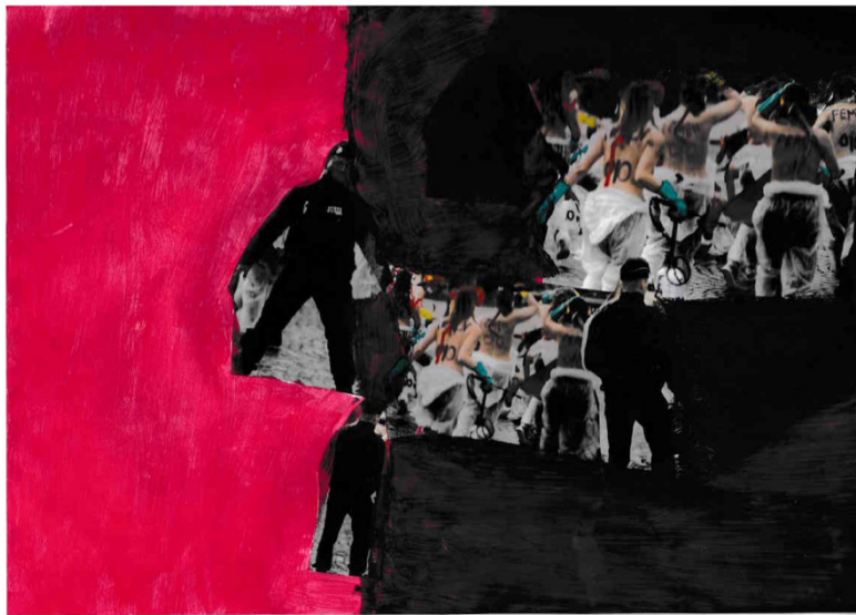
Figure 4. Création d'Ariclènes, élève de 4 e .