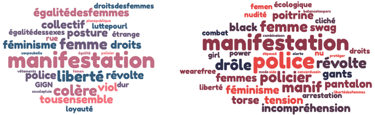
Figure 1 et 2. À gauche, Hashtags de la classe de 4 e . À droite, Hashtags de la classe de 3 e .

Le deuxième aménagement de la démarche en sémiotique sociale, élaborée initialement avec des participants adultes, est la mise en place d’une activité de déplacement dans l’espace, destinée à impliquer physiquement les adolescents dans le processus de sémiotisation et à matérialiser dans l’espace les multiples interprétations. Cette activité avait pour but d’introduire la notion de filtres interprétatifs. Les déplacements des participants ont pu devenir le signe de leurs divergences d’opinion. Cette activité a été élaborée à partir des écrits des élèves et des discussions lors des ateliers de co-interprétation. Les éléments communs et les divergences ont été relevés et ont servi de support à des questions, plutôt antinomiques, incitant les élèves à prendre position et à se déplacer. Les déplacements se sont faits sur deux axes.