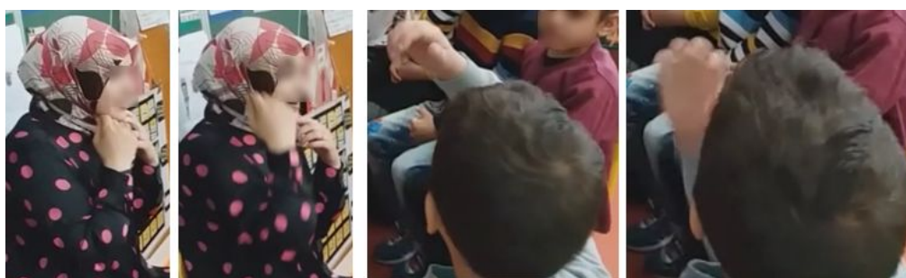
Illustration 2. L'élève reproduit le geste de la mère pour étayer son intervention

Le second peut être considéré comme un « geste à charge culturelle partagée », en référence à la notion de « charge culturelle partagée » proposée par Galisson (1987). En effet, le geste iconique réalisé par la mère (voir illustration 2) symbolise le voile que porte la mère du conte et entretient un lien sémantique avec le signifié concret auquel il renvoie.