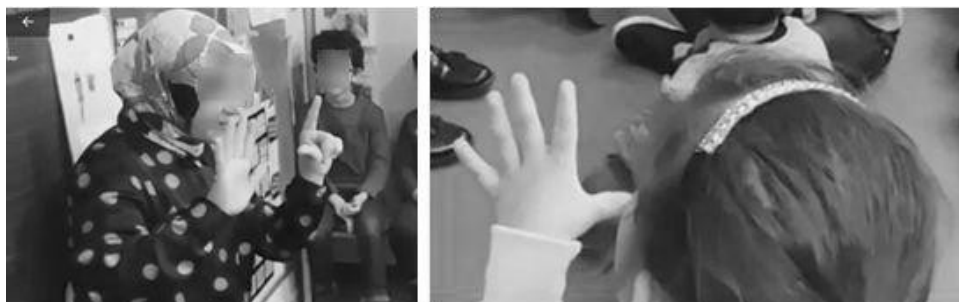
Illustration 1. L'élève reprend spontanément le chiffre 7 produit par la mère

Le second peut être considéré comme un « geste à charge culturelle partagée », en référence à la notion de « charge culturelle partagée » proposée par Galisson (1987). En effet, le geste iconique réalisé par la mère (voir illustration 2) symbolise le voile que porte la mère du conte et entretient un lien sémantique avec le signifié concret auquel il renvoie.