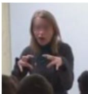
Illustration 3. Geste de l'enseignante pour symboliser « accro »

Prenons l'exemple de ce geste (voir illustration 3) produit spontanément par une enseignante pour symboliser le terme « accro » dans « être accro » :