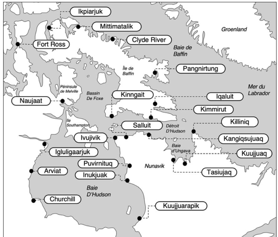
Carte 2 Communautés mentionnées dans le texte

Si l' atiq attribué aux chiens était généralement inspiré par les caractéristiques physiques de l'animal, il arrivait qu'il provienne d'un humain. On donnait l' atiq d'un humain à un chien, par exemple, lorsqu'il n'y avait aucun nouveau-né à qui transmettre celui d'une personne décédée récemment. Le chien à qui l'on donnait un atiq ayant appartenu à un être humain avait un statut particulier puisqu'il était intégré dans le tuqlurausiq (Lévesque 2019). Le chien qui portait l' atiq